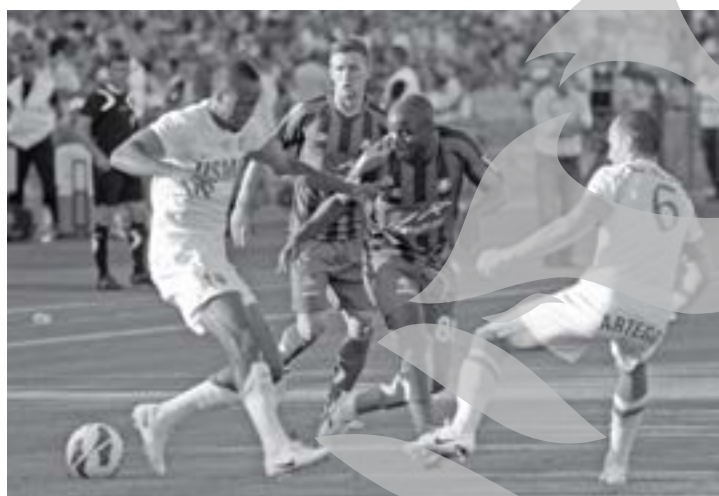
Francezul Inkango a marcat pentru 2-2, în minutul 90

Pentru prima oară de când au fost aduși la Oțelul, cei doi sărbi -