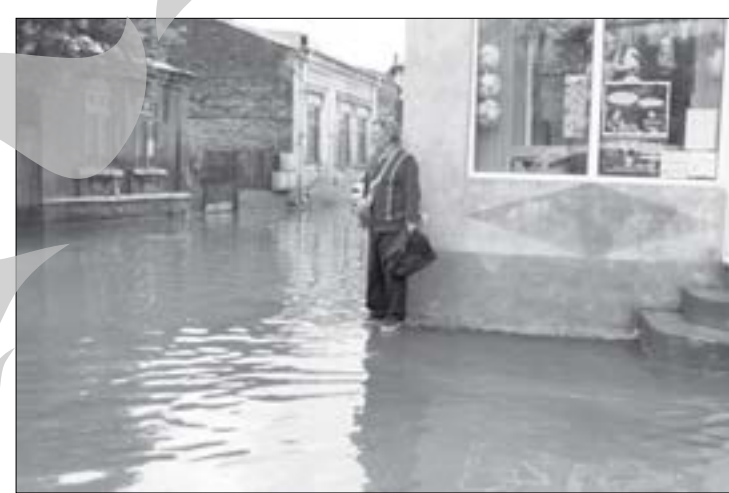
Apă Canal va supraveghea canalizările pentru a evita inundațiile

Problema a fost luată în serios de conducerea Primăriei, care le-a solicitat în mod expres celor de la Apă Canal să aibă în vedere zona. „Domnul primar le-a solicitat celor de la Apă-Canal