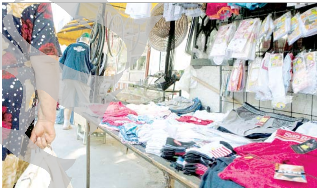
Tarabele blochează traficul pietonal

Ulterior, suprafețele pe care se aflau tarabe au fost betonate și au apărut chioșcurile. Acum, proprietarii vor să transforme chioșcurile în mici clădiri. Pe termen scurt, toți ar avea de câștigat de pe urma unei astfel de măsuri. Pe termen lung, însă, trebuie să ținem cont că zona respectivă este destinată traficului pietonal, nu comerțului.