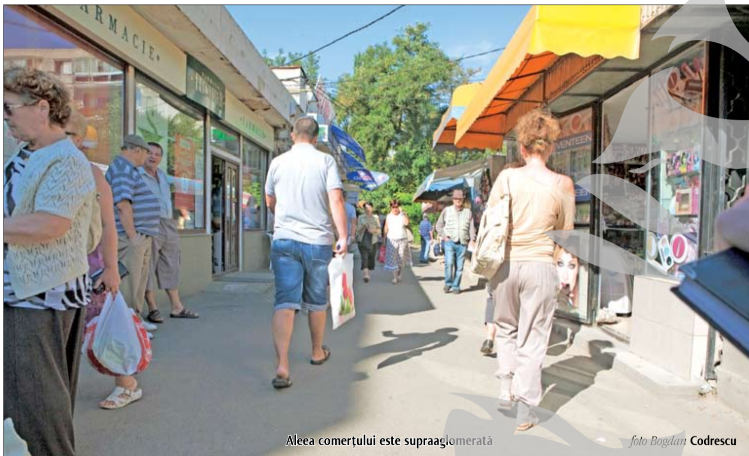
Aleea comerțului este supraaglomerată