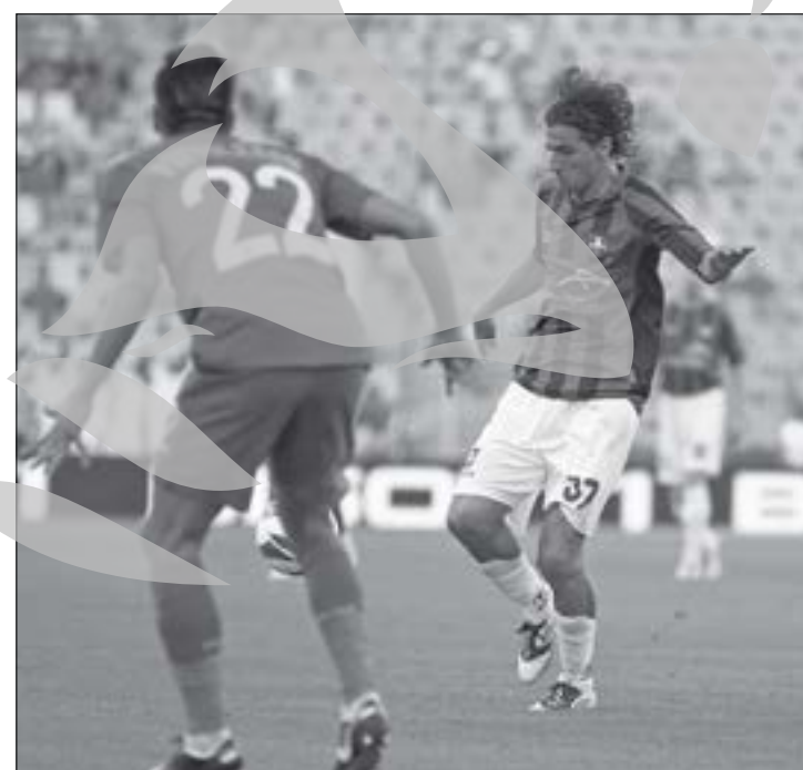
Vigilant, unul dintre puținii jucători care au dat randament în acest start de sezon

De asemenea, odată cu trecerea celor două săptămâni fără meciuri, se apropie momentul revenirii pe teren al unuia dintre cei mai importanți jucători ai Oțelului, brazilianul Cleidimar Magalhães „Didi”, după operația de menis la care a fost supus în vară. Golgheterul din ediția