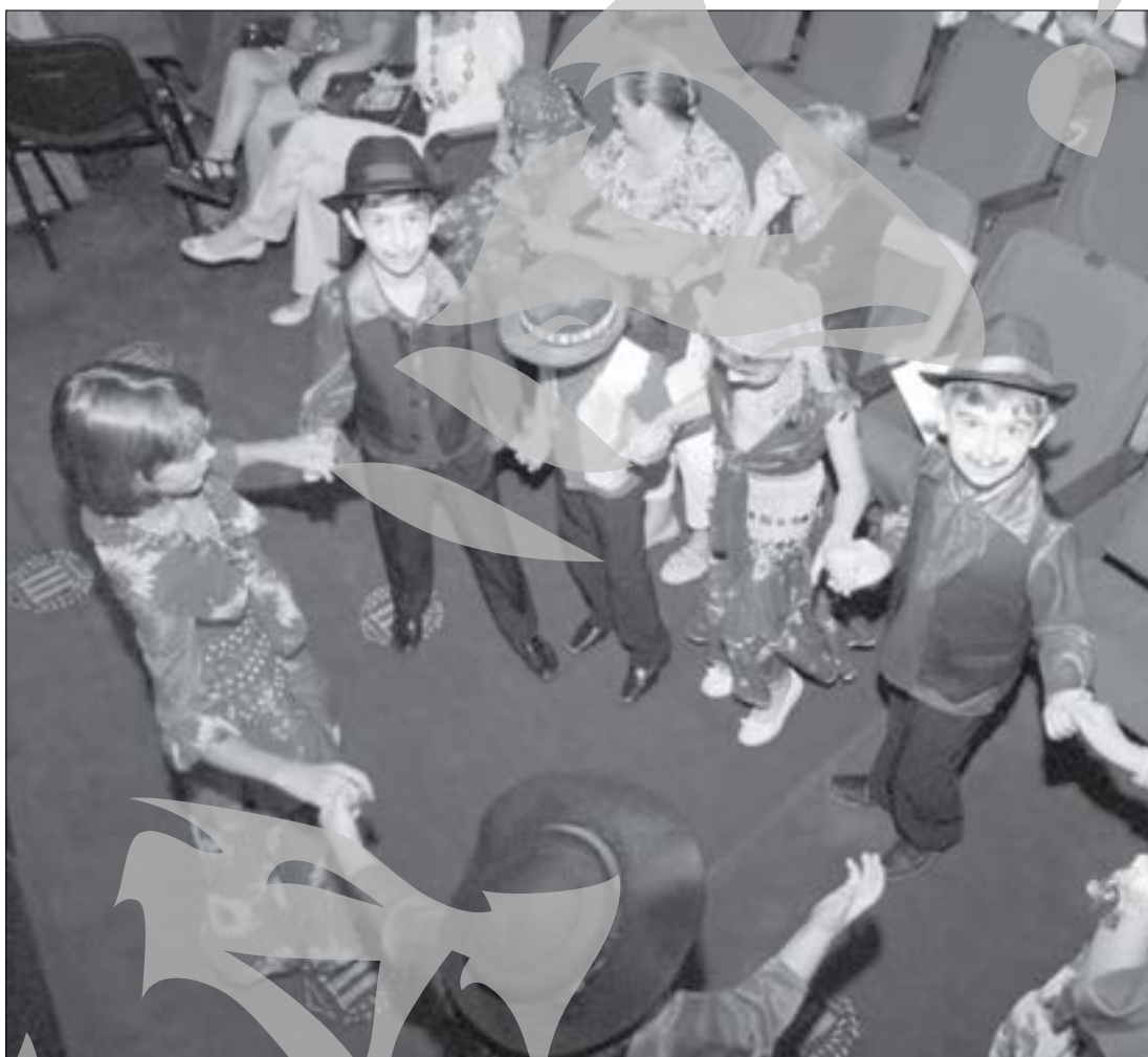
Și copiii au fost la înălțime, în spectacol

noastră și cum au fost ele influențate aici, în țara de adopție, prin proiect întreprinzându-se o cercetare de o săptămână în Grecia. Într-o etapă următoare, ținta va fi Armenia, urmând și altele.