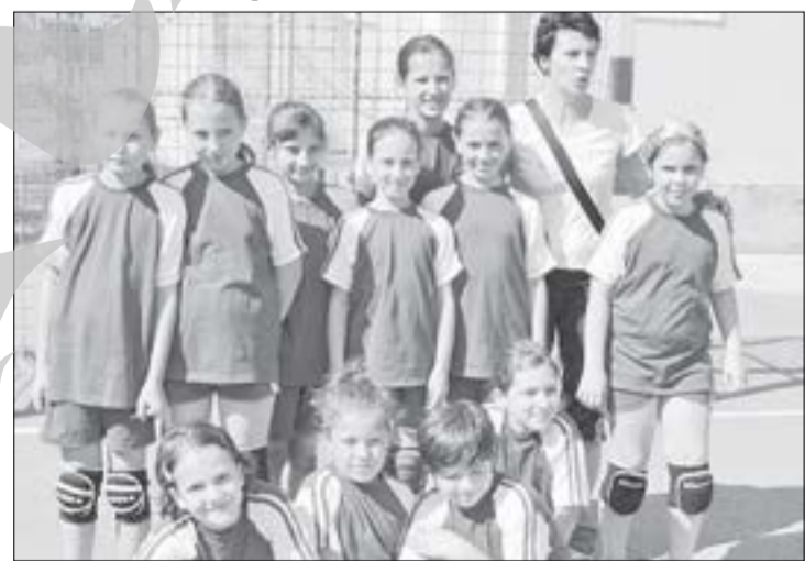
Echipa de minibandbal a HC Danubius

Clasamentul final a consemnat următoarea ierarhie: Olimpic Ploiești, CSS 4 București, CSS