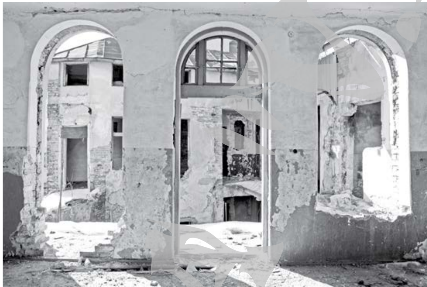
Odinioară somptuos palat, clădirea din Domnească nr. 24 moare încet, dar sigur

Apoi a urmat valul retrocedărilor. Astfel unele imobile au ajuns la proprietarul lor de drept, altele însă au încăput, chiar cu ajutorul din umbră al autorităților (altfel nu se putea), pe mâna vânătorilor de tunuri imobiliare. Nici proprietarii de drept, nici Primăria și