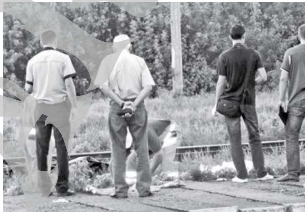
Anchetatorii au fost șocați de cele întâmplate în Gara Barboși