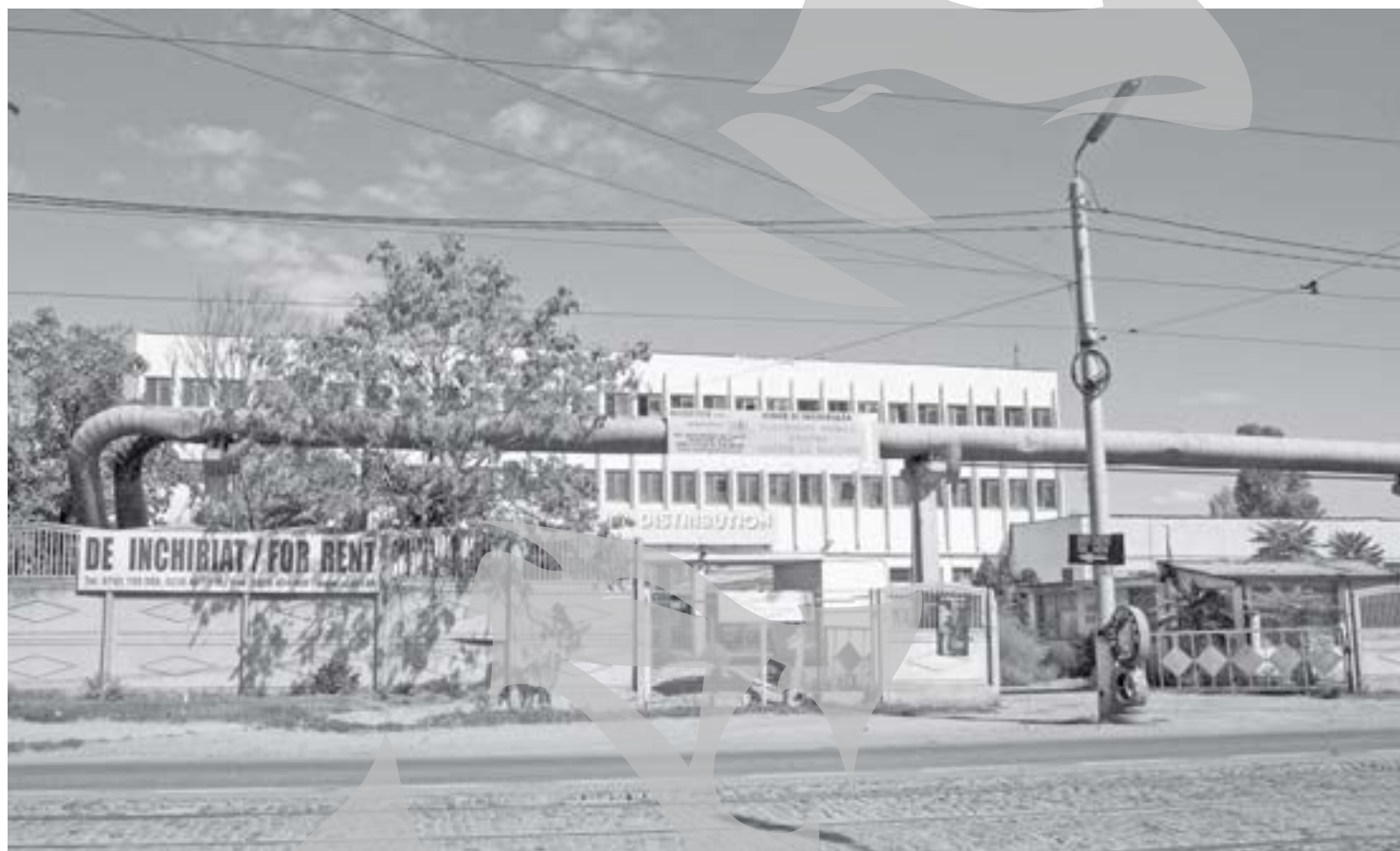
Fostele depozite ale Hortigal SA de pe Calea Prutului