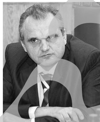
Dr. Vasile Cepoi, ministrul Sănătății

Ministerul Sănătății (MS) va organiza, în săptămânile viitoare, o serie de întâlniri cu managerii și directorii economici ai spitalelor subordonate, pentru o amplă analiză financiară a activității acestor unități. „Vrem să identificăm cauzele dezechilibrului financiar încă existent în unele spitale. O astfel de analiză financiară ne va da posibilitatea să aflăm unde este vina pentru aceste datorii, la managementul unității respective sau în sistemul de finanțare al spitalului. Am cerut să ni se spună exact dacă