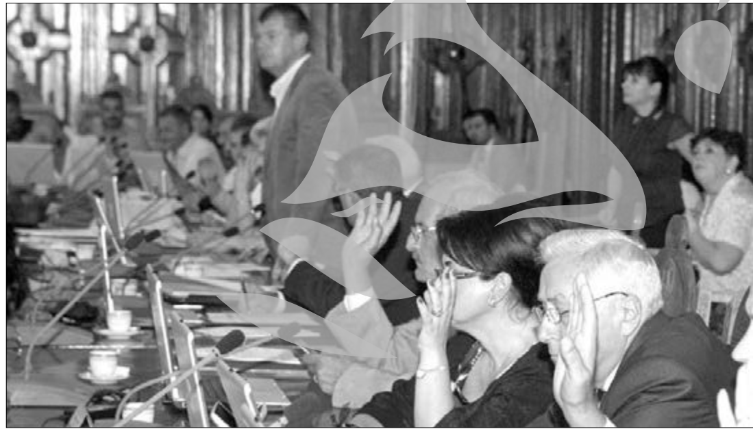
Redresare pentru Consproiect

Consilierul PDL a fost repede redus la tăcere de cei din USL. Potrivit acestora, fondurile de rezervă sunt deschise numai când e vorba de situații de urgență și nu i-a împiedicat nimic pe consilierii PDL să-și facă treaba și să ceară bani pentru localitățile în care există probleme.