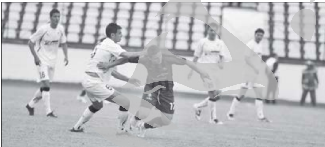
Oțelul a câștigat cu Sportul în ultimele patru confruntări directe, ultima oară chiar în primăvara acestui an