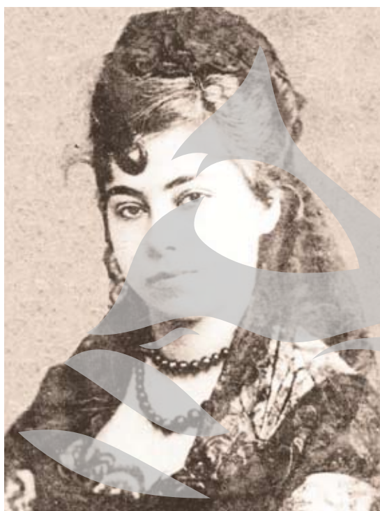
...și la vârsta la care Alecsandri o socotea unică

struit de Belle în via lui Filatoff de pe Calea Domnească, acum Parfumul Teilor, a început cu o dramă a lui Dumas. Succes deplin.