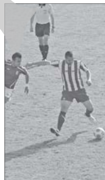
La ultima întâlnire dintre cele două echipe s-au impus gălățenii cu scorul de 3-0