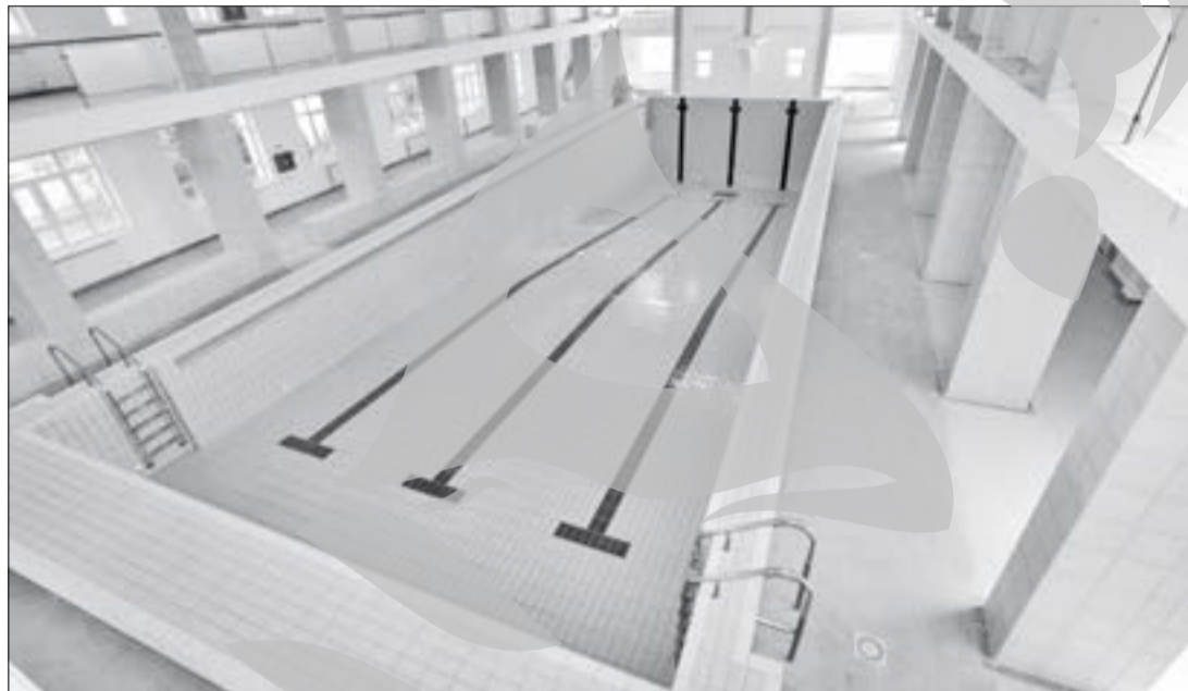
Așa arată bazinul acum, după terminarea lucrărilor

Promisiunile făcute în urmă cu o lună de lucrătorii care s-au ocupat de renovarea bazinului de înot de la Baia Comunală au fost, în sfârșit, respectate. S-au terminat de montat și racordurile speciale la filtre, astfel că în acest moment s-ar putea pune apă în bazin. Însă, redeschiderea pentru public după 12 ani de când s-a pus lacătul pe ușă va fi posibilă abia spre sfârșitul lunii viitoare. Nu se dă drumul la instalație încă pentru că cei care s-au ocupat de proiectele acestei reabilitări au omis să țină cont de un aspect important, că este necesar și mobilierul.