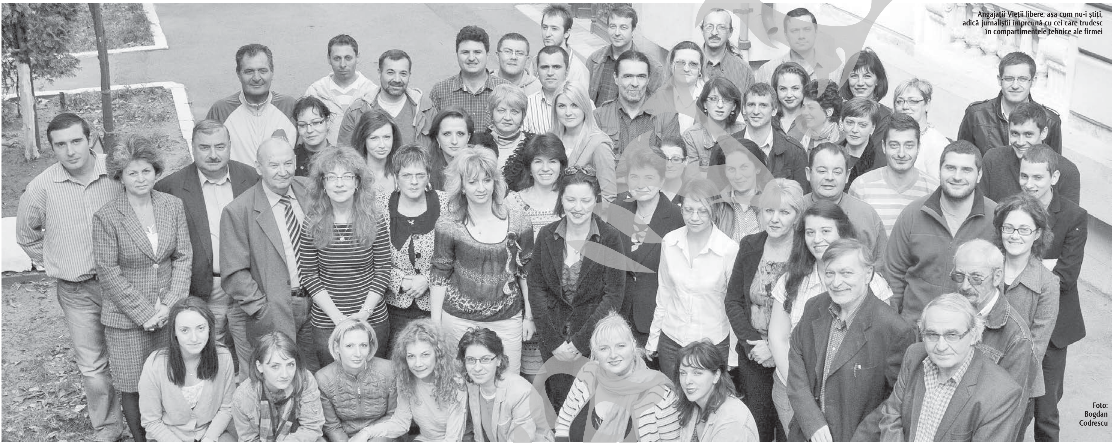
Angajații Vieții libere, așa cum nu-i știți, adică jurnaliștii împreună cu cei care trudesc în compartimentele tehnice ale firmei