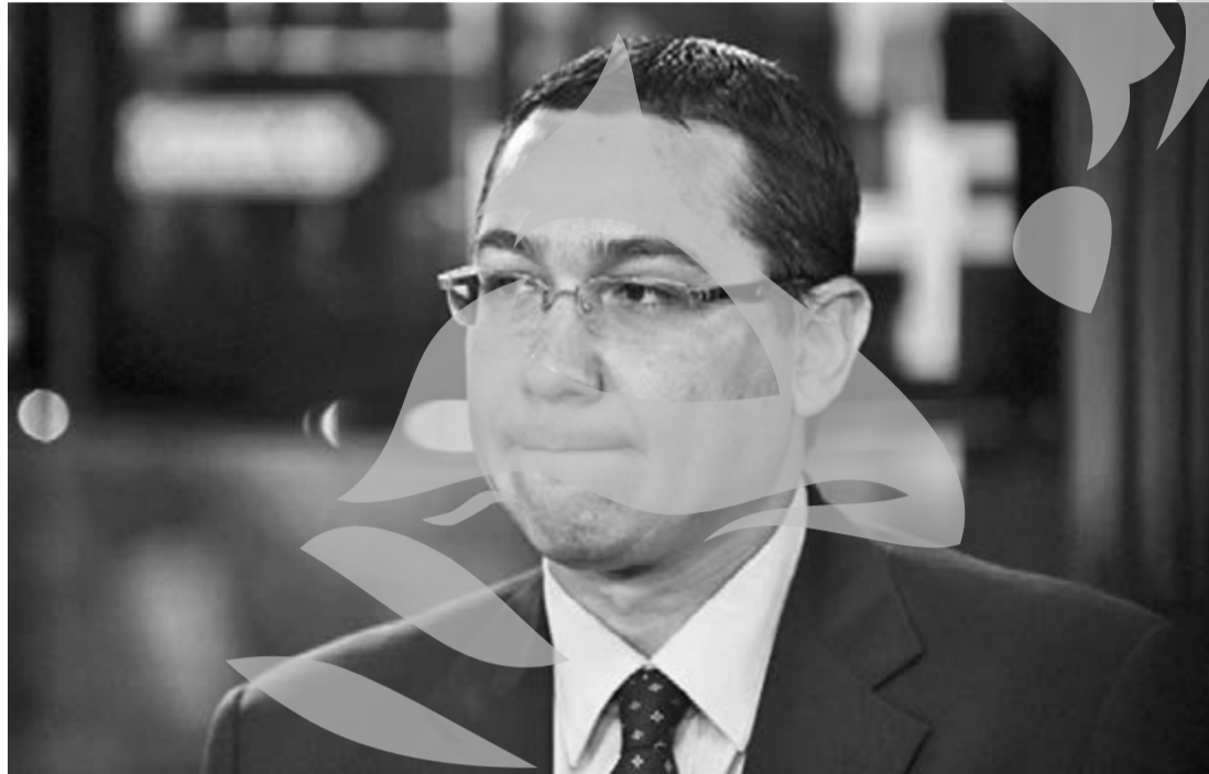
PDL: "Premier incompetent"

Ministerul Finanțelor va acoperi o parte dintre aceste solicitări, în principal pentru agricultură prin subvenții și ajutoare, prin realocări de fonduri, încășări suplimentare și sumele obținute din vânzarea licențelor 4G. Ponta a asigurat însă că există fonduri pentru reintregirea salariilor bugetarilor, rambursarea către pensionari a unei cote din contribuțiile de asigurări de sănătate percepute nelegal și alocările pentru mame.