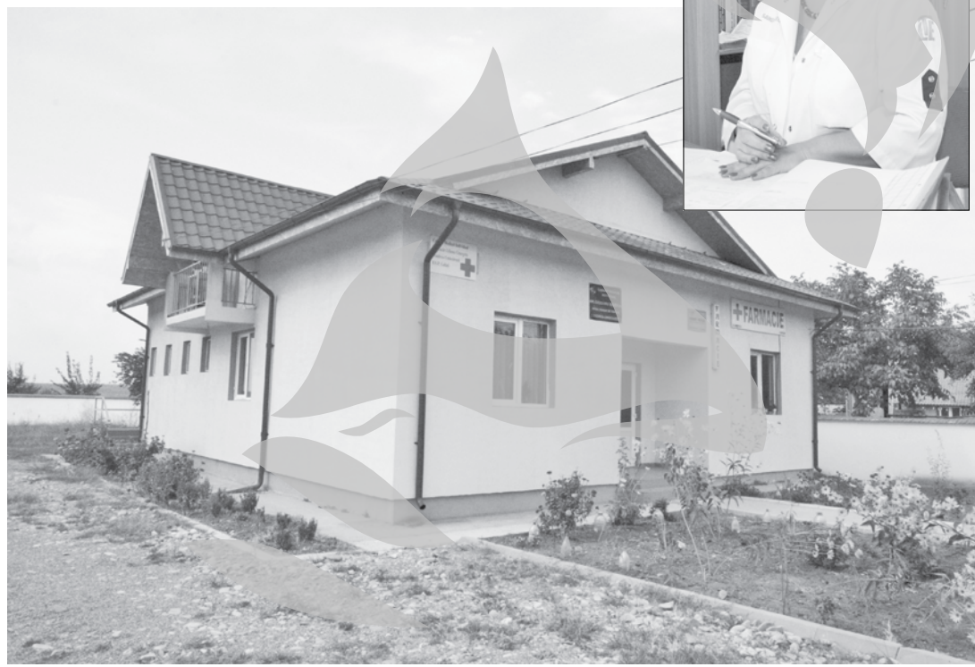
„Mi-am urmărit pacienții cu telefonul”

Cabinetul medical din Condrea are aparatură: un electrocardiograf, un ecograf, un mini-analizator pentru glicemie, urină și colesterol și un laser pentru tratarea bolilor inflamatorii. Plus oscilometrul care poate depista la timp anumite boli arteriale periferice, doar dacă există dorința pacienților.