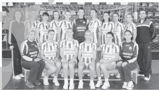
Echipa HC Danubius Galați

Conducerea executivă a echipei feminine de handbal Danubius Galați a decis să accepte oferta de a juca în deplasare ambele manșe din turul trei al Cupei Cupelor. Adversara echipei gălățene este formația spaniolă Balonmano Bera Bera, cele două jocuri urmând să se dispute pe 10 și 11 noiembrie. Decizia conducătorilor echipei gălățene a fost luată din rațiuni financiare, cumulate cu cele de ordin sportiv, preferându-se să se reducă din cheltuieli în condițiile în care șansele de calificare sunt infime având în vedere potențialul din acest moment al fetelor de la Danubius.