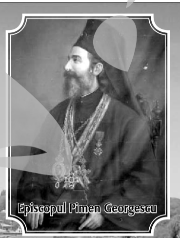
Episcopul Pimen Georgescu