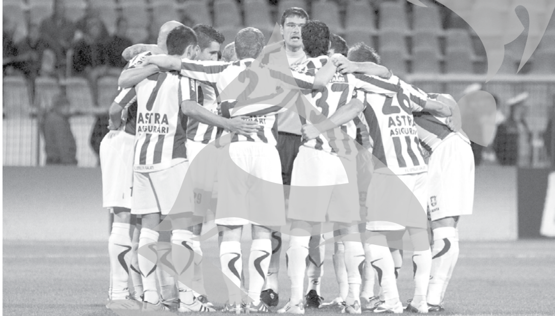
Echiperii Oțelului sunt obligați să și strângă rândurile pentru a sparge seria meciurilor fără victorie