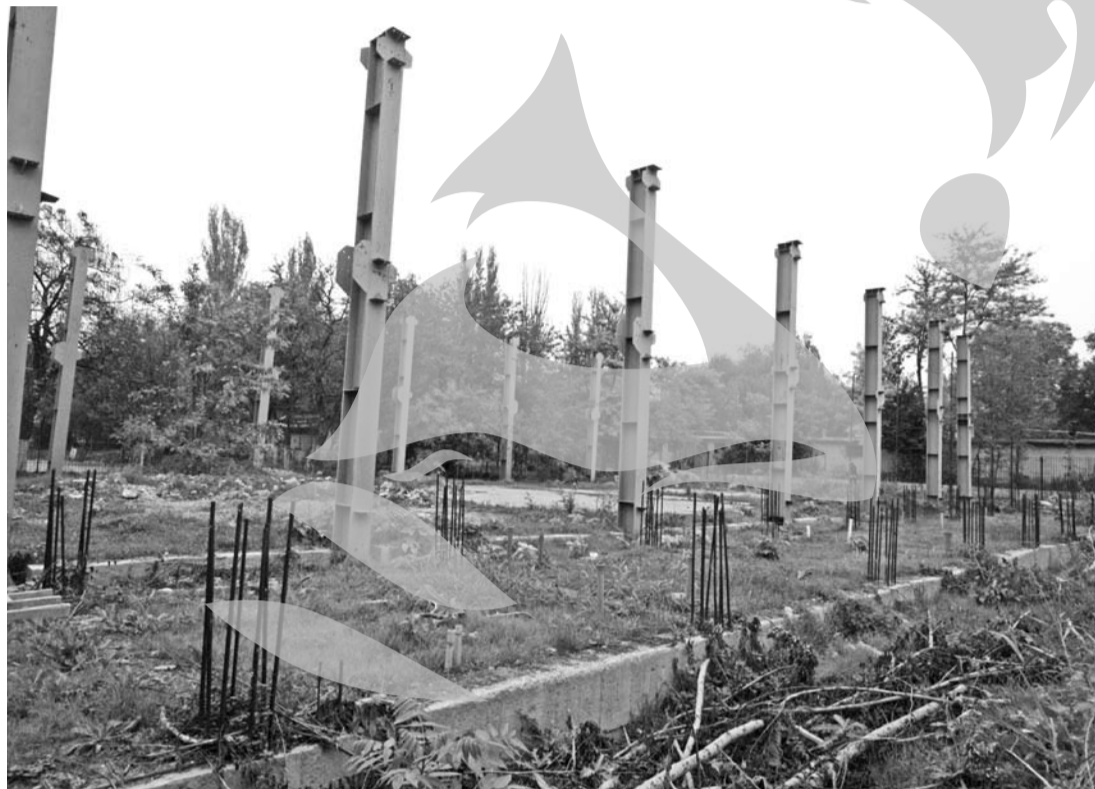
Ruinele din curtea Școlii Nr. 7