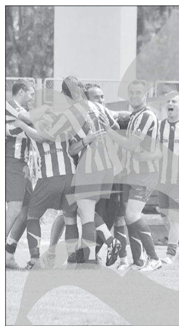
Cei de la Dunărea vor să trăiască bucuria primului succes în deplasare din acest sezon

* Meciurile restanță din Campionatul Național al juniorilor A și B, dintre echipele