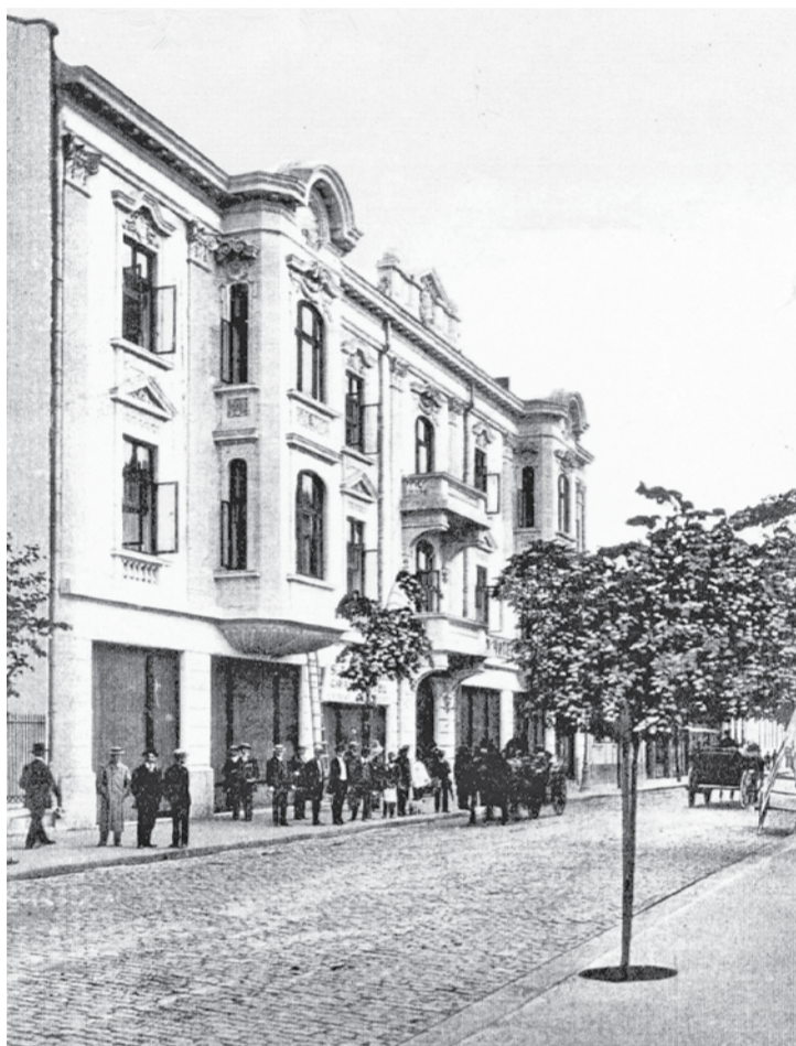
"Grand Hotel" - fotografie de epocă

Jumătate de secol a fost hotel de lux, apoi, în perioada comunistă, naționalizat, devine sediul al Consiliului Popular - administrația PCR a orașului, iar din 1990 este Primărie. Clădirea frumos decorată, în stil neoclasic și baroc (plus parcul din vecinătatea clădirii; în total, 3.262 de metri pătrați), revendicată îndelung și câștigată în instanță (mai puțin... hruba, ignorată prin tradiție, care a dus la prăbușirea străzii Logofăt Tăutu) a rămas sediu, cu chirie pipărată, până când aleșii noștri se vor hotărî fie să dea bani pentru un costisitor sediu nou, fie să plătească în continuare o roabă de bani chirie; în consolidare nu poate nimeni investi.