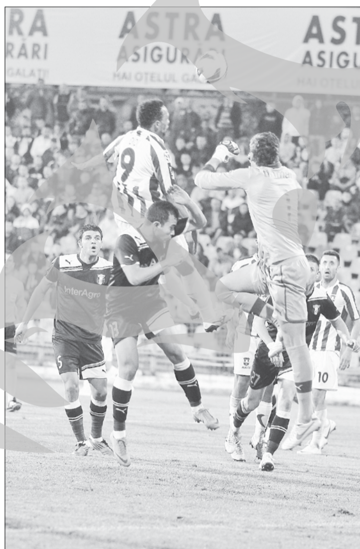
„Oțelarii” au un program accesibil în următoarele trei etape pentru a forța evadarea din zona incomodă a clasamentului