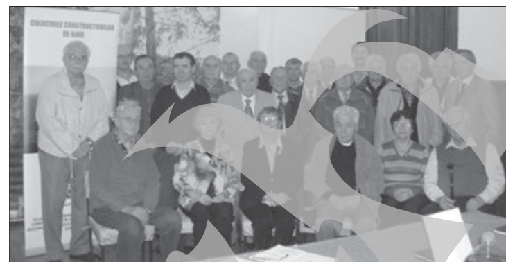
O fotografie pentru istorie: navaliștii de aur ai Galațiului