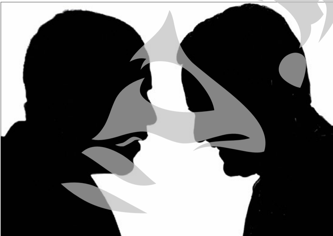
Obama și Romney, umăr la umăr

Președintele este ales indirect, prin intermediul marilor electori desemnați cu majoritate de voturi în fiecare stat. În acest caz, cel care obține cel mai mare număr de voturi într-un stat câștigă toți marii electori care sunt