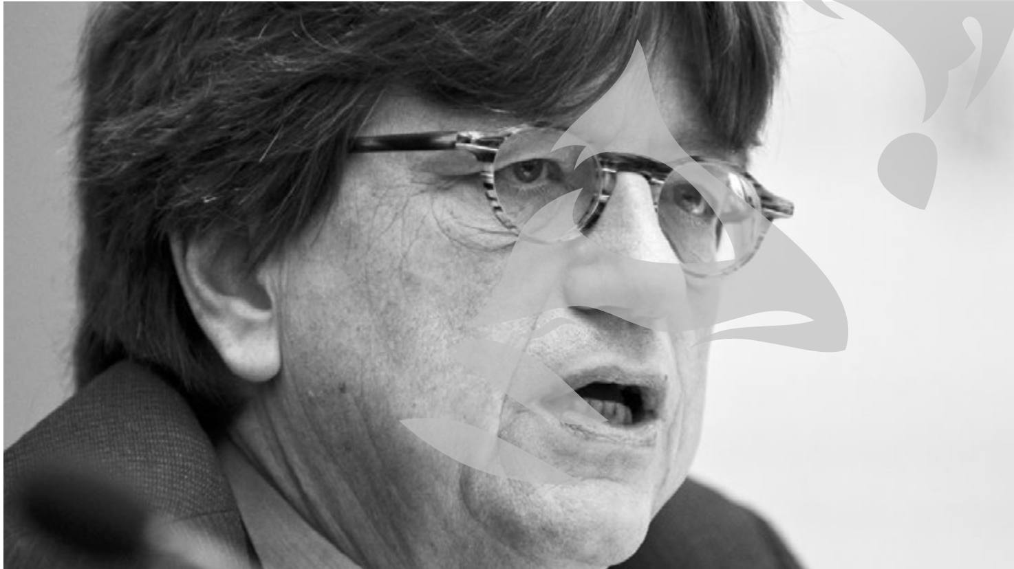
Șeful misiunii de evaluare a Fondului Monetar Internațional, Erik de Vrijer

Anul acesta, Fondul Monetar Internațional a scăzut prognozele privind creșterea economică a României de la 4 la 3,5 la sută, din cauza întârzierilor cu reformele structurale și a incapacității noastre de a absorbi fonduri europene. FMI estimează că până în 2014 potențialul de creștere a economiei românești va rămâne sub doi la sută, dar va crește gradual la trei procente până în 2017. România