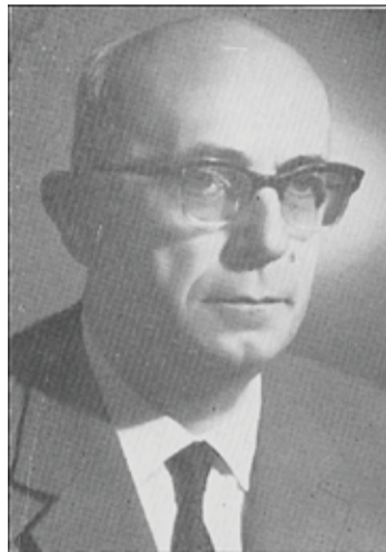
istorice române” – al cărei prim număr a apărut în anul 1930.

Se împlinesc, în această zi, 35 de ani de la încetarea din viață (13 noiembrie 1977) a unuia dintre importanții istorici români ai secolului al XX-lea. Născut (26 octombrie 1901) la Foșșani, Constantin C. Giurescu a absolvit cursurile Facultății de Istorie și Geografie a Universității București. Devine doctor în Litere și doctor docent în Istoria românilor (1925). Între anii 1923 și 1925, a activat în cadrul Școlii Române din Paris, după care, întors în țară, a fost profesor la Facultatea de Litere și la cea de Istorie ale Universității București și cercetător științific la Institutul de Istorie „Nicolae Iorga” din București. A conferențiat la universități din Marea Britanie și SUA; la Columbia University din SUA a ținut primul curs de „Civilizație românească”. S-a numărat printre membrii fondatori ai Institutului de Istorie Națională (1941) și ai „Revistei