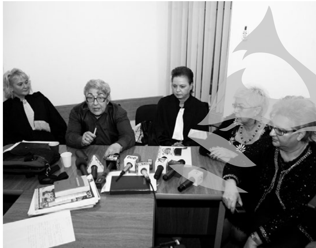
Avocații sunt supărați pentru că sunt tratați diferit

Din august și până în noiembrie nimeni nu a luat o decizie. Pe 5-6 noiembrie, decanul Baroului Galați a participat la o întâlnire cu reprezentanții conducerii Curții de Apel pentru a discuta problema spațiului. „S-a propus conducerii Baroului Galați închirierea, pe viitor, a două camere (față de o cameră, cât s-a propus inițial), cu condiția eliberării până la data de 12 noiembrie 2012 a camerelor P8, P11 și P12, care nu vor mai face obiectul închirierii. Aceasta întrucât, în urma rectificării bugetare aprobate de Guvern prin O.U.G. nr. 61/27.10.2012, s-au alocat fonduri pentru amenajarea, la nivelul fiecărei instanțe, de camere de consiliu (conform modificărilor la Codul de procedură civilă ce urmează să intre în vigoare la începutul anului 2013), iar fondurile respective trebuie cheltuite în regim de maximă urgență, respectiv, până la data de 15 decembrie 2012”, se arată în-