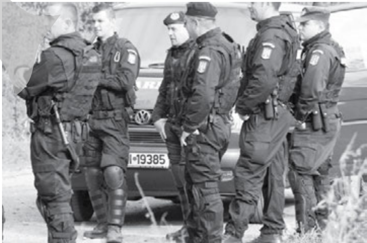
Răfuielile mafiei fierului vechi sunt din ce în ce mai frecvente în județul Galați