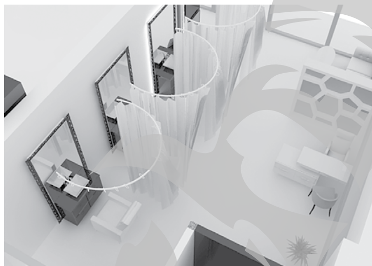
Zona pentru bărbații care vor să fie mereu impecabili

„Am lucrat foarte mult cu tinerii, în special cu băieții, și am observat că au grijă tot timpul de părul lor - aleg frizuri la modă, se dau cu gel. Lucrurile nu se schimbă când ajung la maturitate - oamenii de afaceri, de exemplu, se împropătează înaintea unei întâlniri importante”, spune