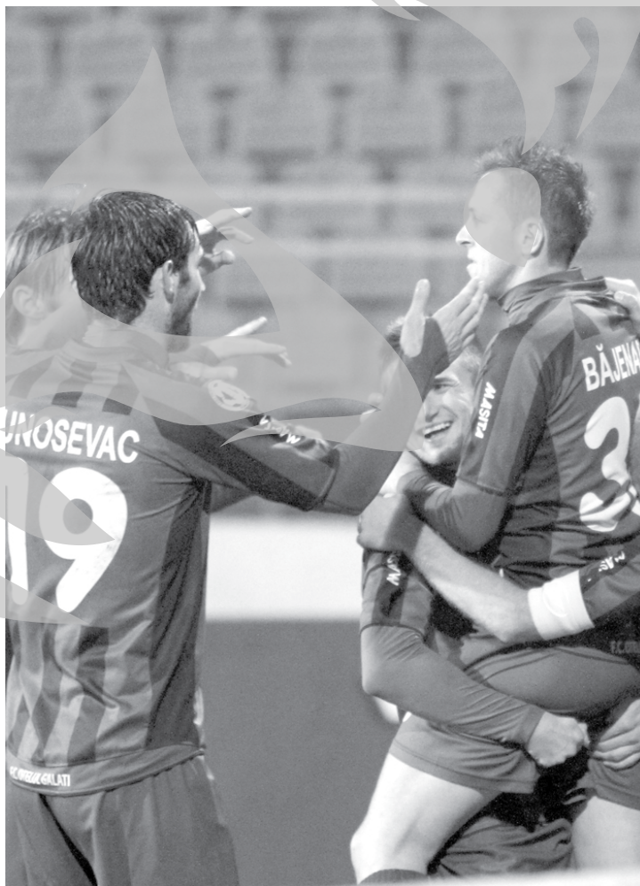
Oțelul are nevoie de toate cele trei puncte în această seară pentru a se distanța de echipele aflate în zona retrogradării