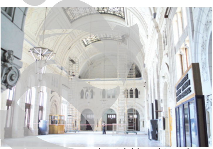
Universitatea "Dunărea de Jos" - holul corpului central

Reabilitarea sediului central este doar una dintre investițiile importante pe care le are în vedere conducerea „Dunării de