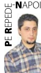
PE REPEDE - NAPOI