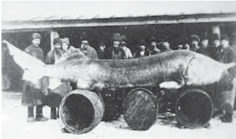
Un exemplar de aproape o tonă prins la începutul anilor 1900

La începutul anilor 1900, România era un adevărat paradis al icrelor negre. Sute de tone de morun, nisetru, păstrugă și cegă erau pescuite anual din Dunăre. La morun, de exemplu, cel mai râvnit dintre sturioni, capturile au crescut constant de la începutul secolului al XX-lea și până la începutul celui de-Al Doilea Război Mondial. În anul 1941 s-a înregistrat cea mai mare cantitate de morun capturată vreodată la noi în țară: aproximativ 900 de tone. Asta înseamnă aproximativ 2,5 tone de morun în fiecare zi, adică cel puțin 250 de kilograme de icre negre. La prețul de astăzi de pe