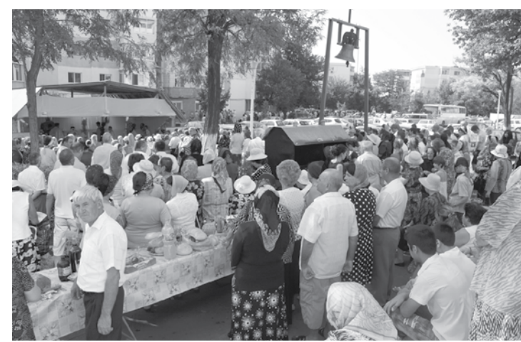
Creștini, la hramul din 5 august 2012

La mică distanță erau neguțătorii care vindeau vechituri în talcioc, fapt care l-a determinat atunci pe înalt Prea Sfințitul Casian al Dunării de Jos să spună că parcul din fața blocului unde este acum parohia „nu este adecvat de Sfânt Altar închinat