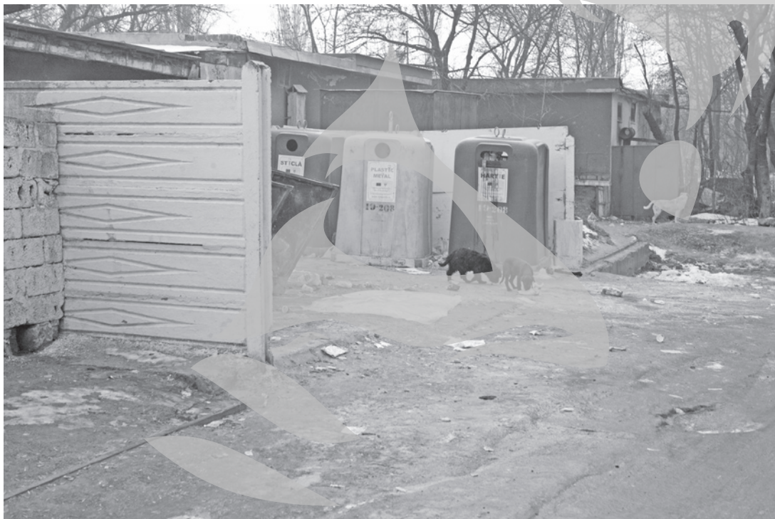
Unii dintre locatari aruncă gunoiul direct pe alei sau în grădinile dintre blocuri

cele câteva minute cât am rămas în loc, am putut număra 12 câini, care au venit cu rândul, curioși de ceea ce se afla în pungi. „Au o gaură în peretele din spatele tomberoanelor, unde se adăpostesc. Dacă un copil sau un bătrân vine să aducă gunoiul, sunt șanse mari să plece de aici mușcat”, ne spune unul dintre locatarii blocului CS 6.