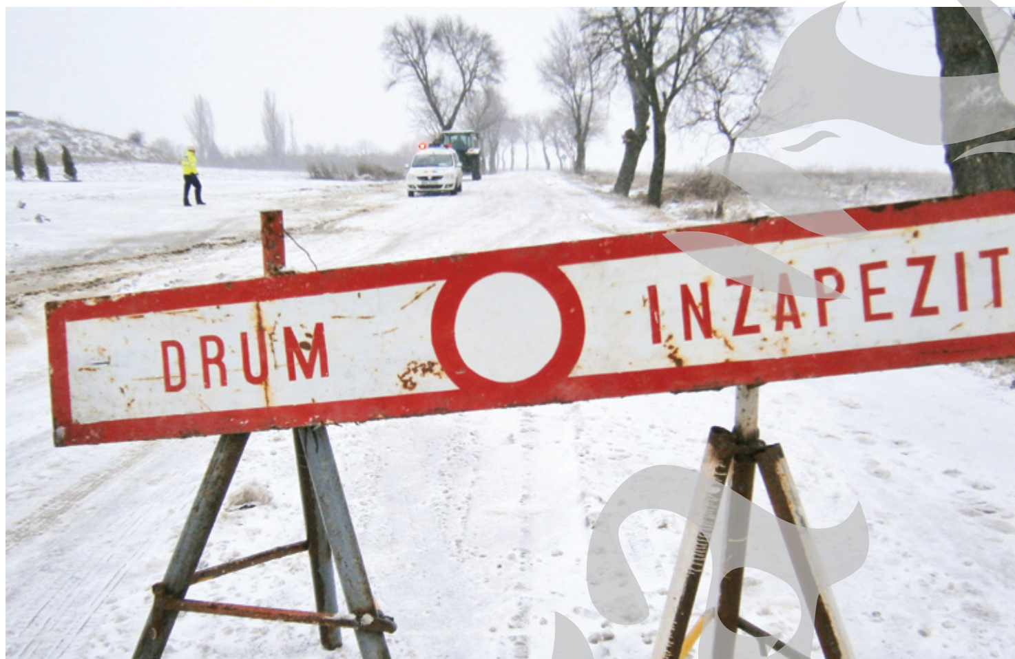
Text și foto: Teodora Miron

Drumul Național 24 D Galați - Cucu - Bârlad, închis din motive de siguranță