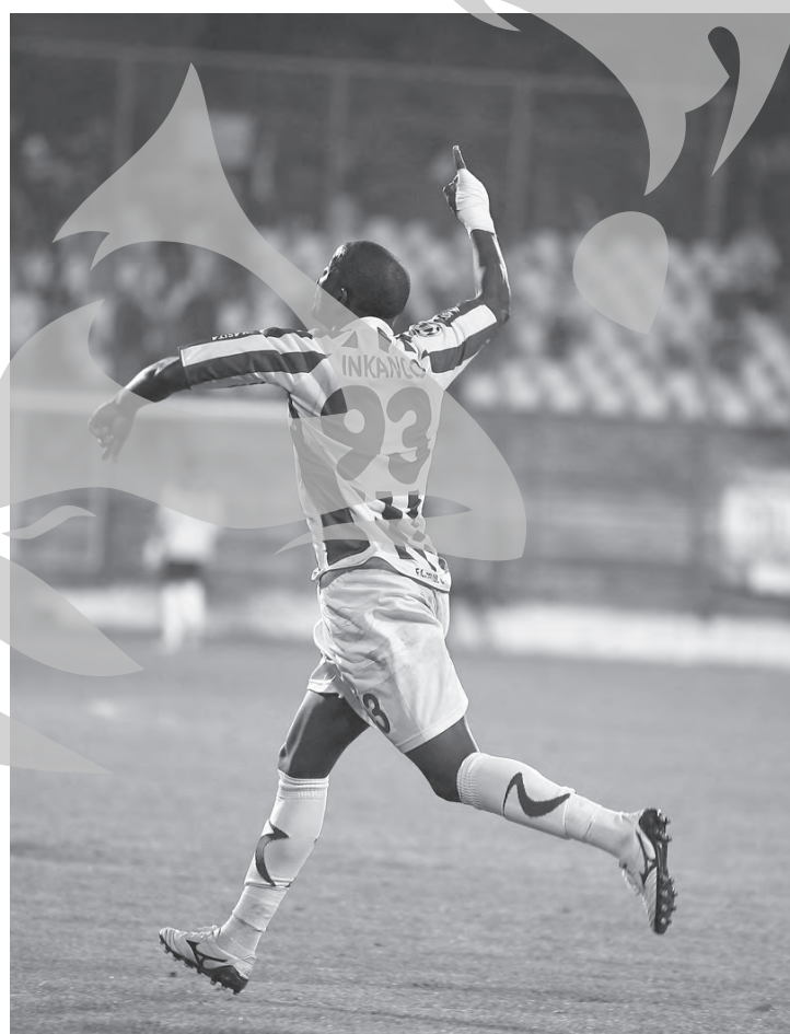
Inkango, unul dintre cei mai buni jucători ai Oțelului în prima parte a sezonului, va absenta mai bine de o lună