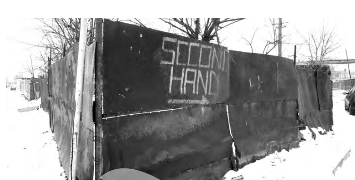
Aspectul de "mâna a doua" al cartierului este ilustrat chiar și pe gardurile mâncate de rugină