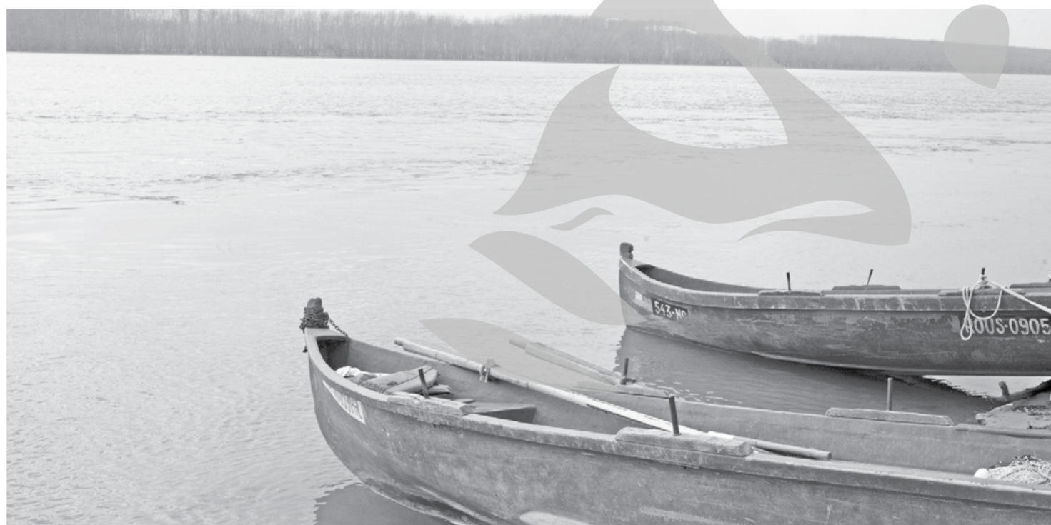
Bărcile pescarilor mai mult stau pe mal decât sunt folosite la prins pește

Statisticile din ultimii ani arată ceea ce multă lume bănuia: în Galați pescuitul nu mai e deloc la nivelul anilor '70-'80