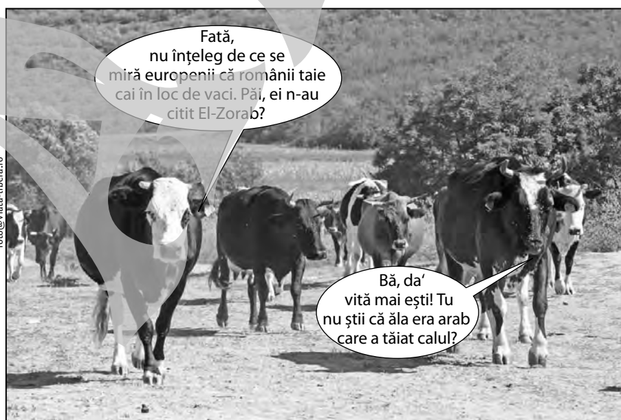
Vaci din județul Galați în timpul unei dispute pe un subiect literar-culinar