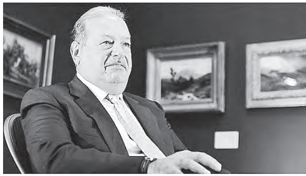
Carlos Slim, cel mai bogat... miliardar din lume