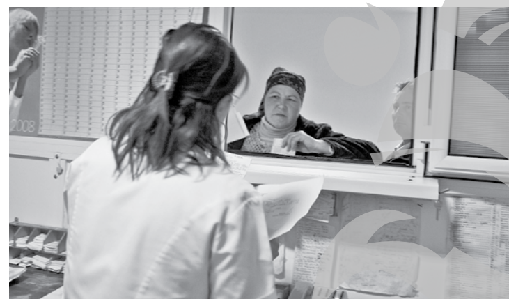
În multe centre, la datorie e doar asistenta

Medici de gardă lipsă, uși închise sau condiții improprii de acordare a asistenței. Sunt con-