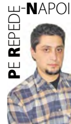
PE REPEDE - NAPOI