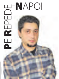
PE REPEDE - NAPOI