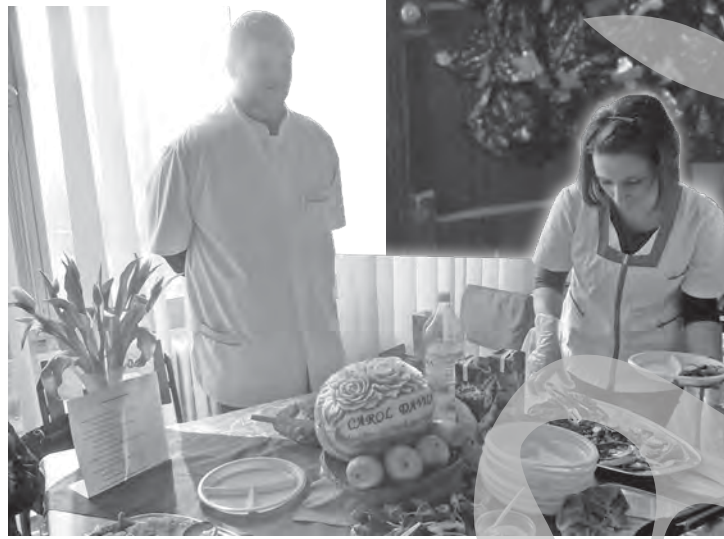
Și un pepene sculptat... dietetic, în expoziția gustoasă de la „Davila”

re comunistă și că vine din SUA. Alături de colegi veniți în practică din Spania, Belgia și Suedia, elevii au degustat apoi dintr-o expoziție de bucătărie mmm, dietetică, cu dedicații diferitelor afecțiuni. Dar „bomboana de pe tort” a constituit-o o paradă a modei fulminantă, cu rochii eco: