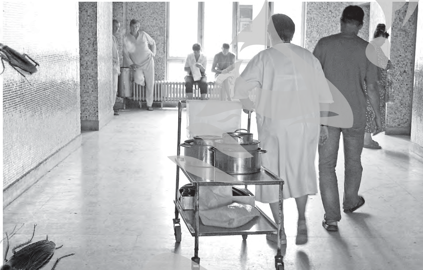
Începând de miercuri, zeaama care le este servită clienților a început să fie filtrată, pentru a evita apariția gândacilor și a eventualelor urme de legume fierte

Primele concluzii ale anchetei interne de la Județean indică faptul că nu bucătăresele au fost vinovate pentru că în zeamă bărbatului au ajuns cele 3 grame de carne care i-au căzut greu la stomac. Cantitatea de carne era de fapt un gândac de bucătărie,