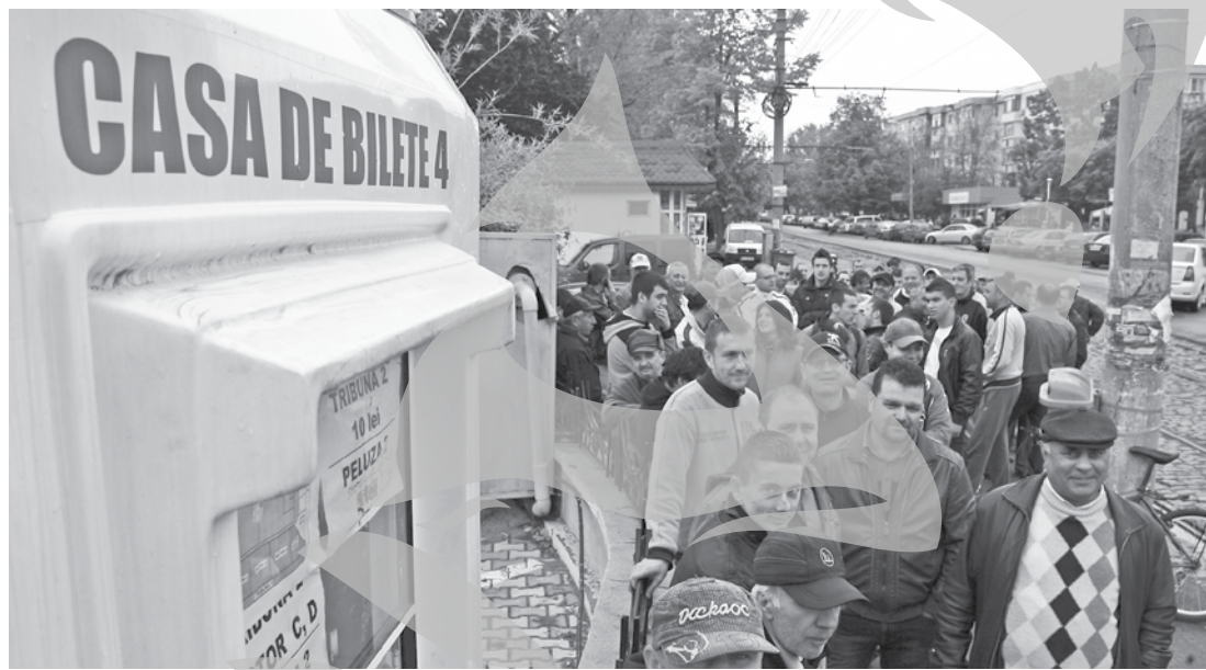
Prin prețul mărit se dorește și răirea suporterilor steliști la casele de bilete