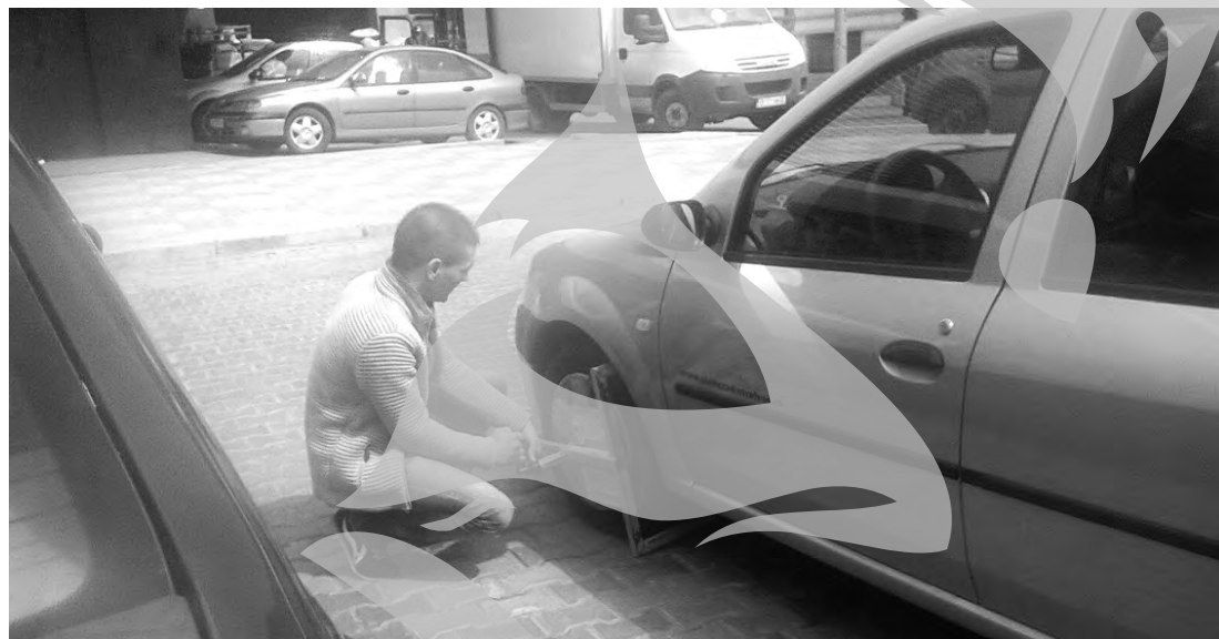
După ce iau banii prin geamul fumuriu, băieții ADP-ului îi deblochează roata

În primul rând, aparatul de taxat cu pricina din zona Winmarkt