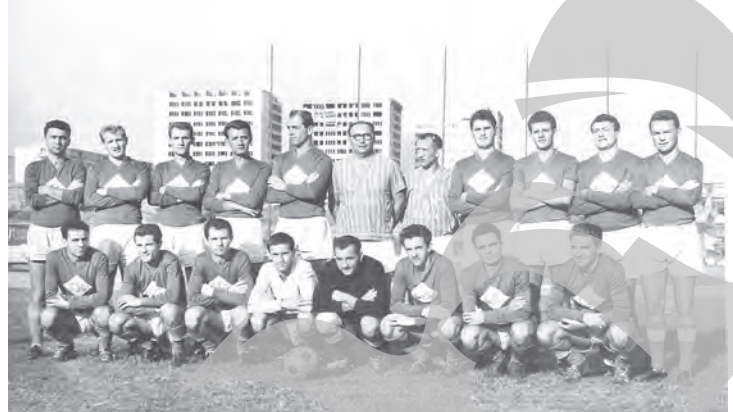
Echipa Siderurgistul Galați, finalista din 1963 a "Cupei României"