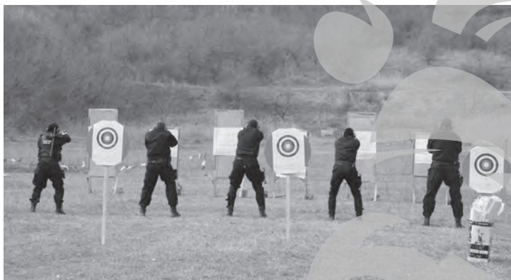
Luptători SAS, în timpul unei sesiuni de tragere

Evenimentul, petrecut luni după-amiază, l-a avut drept victimă pe un polițist din cadrul trupelor speciale ale IPJ Galați. Totul s-a produs în poligonul de la Smârdan, o locație folosită de luptători pentru tragerile speciale care fac parte din sesiunile lor de pregătire. În împrejurări care acum sunt în curs de elucidare, polițistul, în vârstă de 28 de ani, a fost rănit în coapsa stângă de un corp metalic de mici dimensiuni. Agentul a primit pe loc prime-