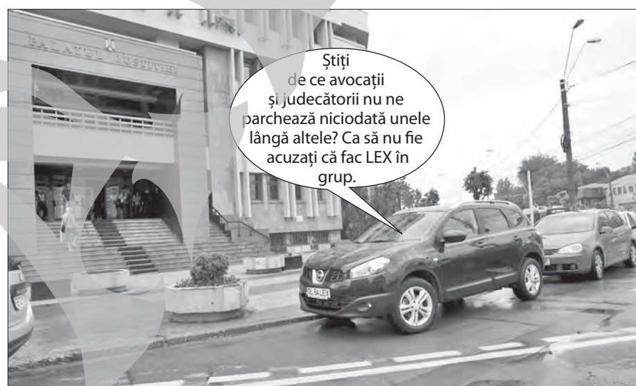
Mașină de avocat plângându-se că nu a mai fost de multă vreme acuzată în teava de eșapament