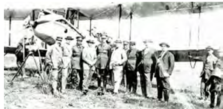
Așa arătau primele avioane care au ajuns la Galați

de zbor fără motor la Iași, apoi una cu motor la Strejnic - Ploiești. „Am terminat școala acolo, pe 21 octombrie '51 am luat brevetul. Brevetul meu era de pilot internațional de turism. Apoi nu s-au mai dat, s-au dat brevete de pilot sportiv. La piloții internaționali se cerea să faci raiduri, acrobație, la cel sportiv era mai simplu.” După școală, l-au încorporat, în noiembrie '51. „În timp ce ne examinăm medical, eram în pielea goală, dar aveam brevetul de pilot în mână. Vorbeau între ei: «Dumule, la Marină e nevoie de recruți!», iar eu mă dădeam de ceasul morții că voiam la Aviație.” A convins însă pe cineva brevetul, atunci singura „haină” a pilotului: „Omul are chemare”, au spus, și m-au trimis la Turda, la Aviație”. În 1952, când își formau serii pentru instrucție, aveau nevoie de foștii piloți și a fost mutat