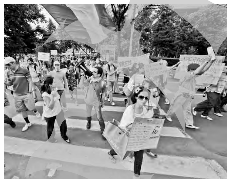
Bucureșteni, manifestând împotriva agriculturii cu OMG

Mii de persoane s-au reunit sâmbătă în mai multe orașe europene, printre care și București, pentru a protesta față de gigantul american agrochimic Monsanto și în general față de organismele modificate genetic (OMG), pesticide și alte produse chimice.