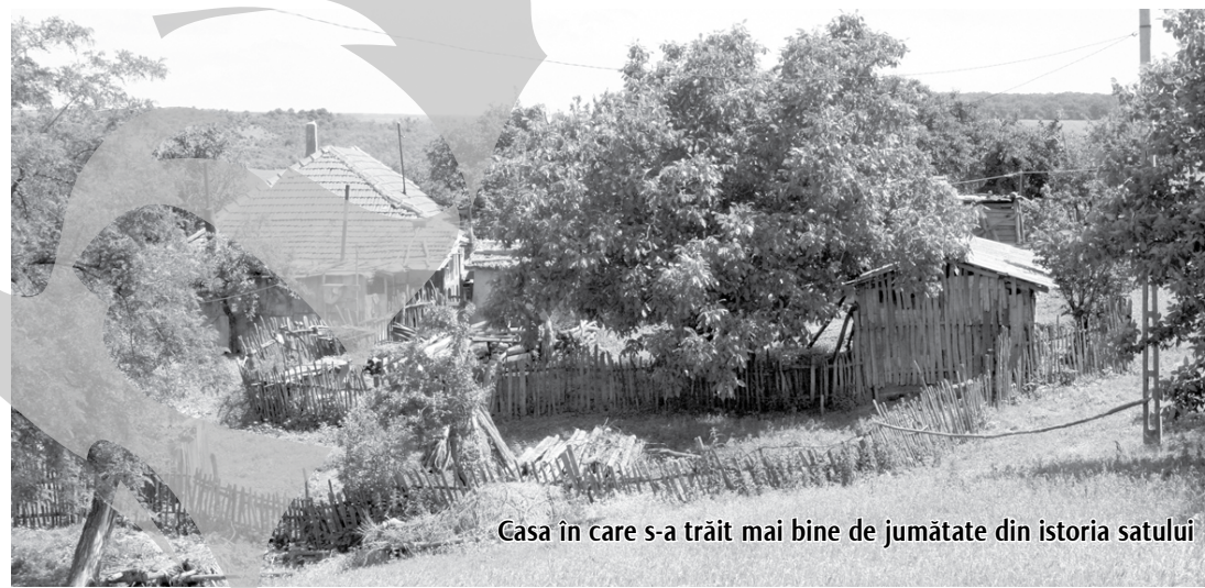
Casa în care s-a trăit mai bine de jumătate din istoria satului

Până în anul 1968, alături de cătunul Zimbru, despre care v-am scris săptămâna trecută și alături de Miroasa, satul din care a rămas doar cimitirul, cătunul Oanca a făcut parte din comuna Rădești. Potrivit cercetărilor istoricului Paul Păltănea, Oanca a fost atestat documentar încă din anul 1830. Ar fi vrut și pe aici comunității să tragă brazde peste vatra satului, dar n-au făcut-o. Deși nimeni din sat nu-și mai amintește, folclorul locului menționează că oamenii din Oanca erau poreclii „surzii”, cel mai probabil din cauza faptului că gospodăriile sunt răsfrate și cine vrea să se facă auzit de vecin trebuie să vorbească tare și apăsat.