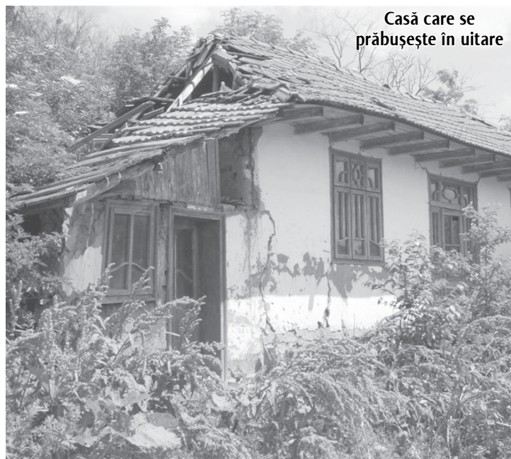
Casă care se prăbușește în uitare