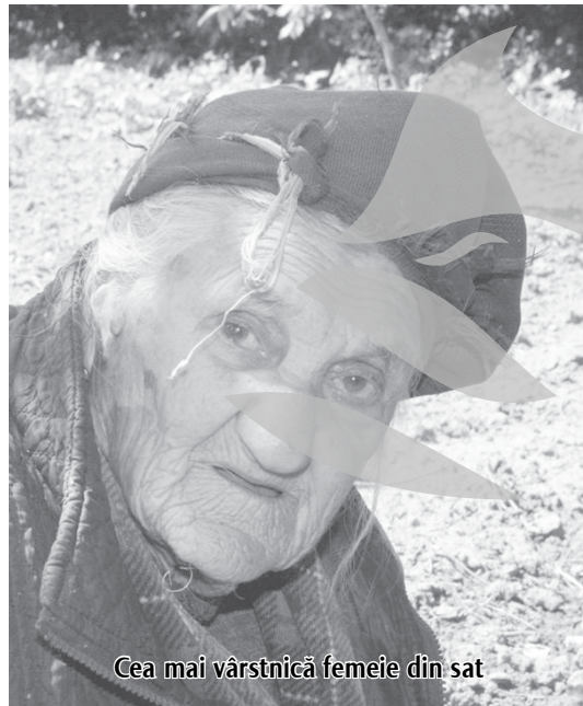
Cea mai vârstnică femeie din sat