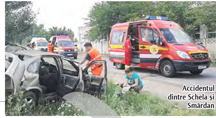
Accidentul dintre Schela și Smârdan