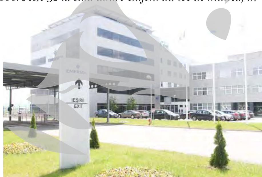
Parc industrial la Cluj