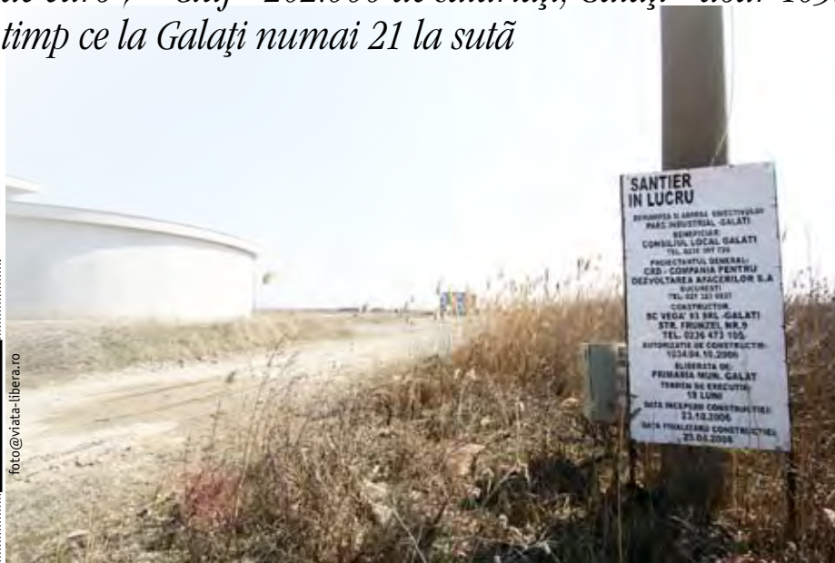
Parc industrial la Galați