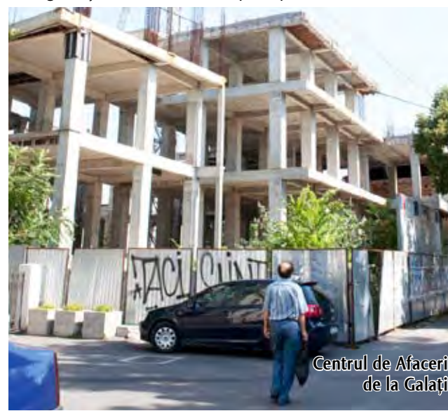
Centrul de Afaceri de la Galați