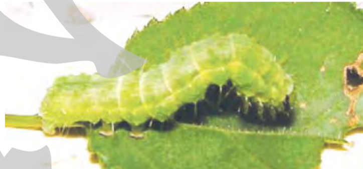
Milioanele de fluturi vor duce la apariția a nenumărate omizi

Fluturile este unul deosebit de rezistent la condițiile meteo vitrege, fiind răspândit nu doar la noi în țară, ci și în toată Europa,