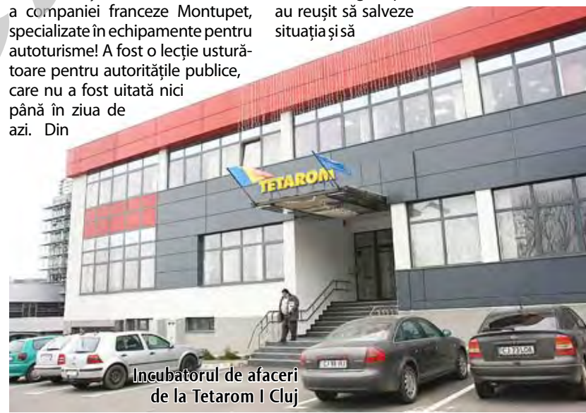
Incubatorul de afaceri de la Tetarom I Cluj