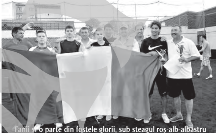
Fanii s-au parte din fostele glorii, sub steagul roș-alb-albastru

Cea de-a șaptea ediție a Cupei „Peluza Sud”, competiție fotbalistică organizată de supporterii Oțelului, a fost o adevărată sărbătoare a spiritului roș-alb-albastru. Fanii au fost onorați de prezența unei echipe formate din fostele glorii din anii '90 ale Oțelului,