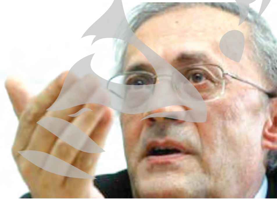
Președintele Colegiului Medicilor din România, Vasile Astarăstoae

Salariile în domeniul sanitar nu vor crește în acest an, însă în proiectia bugetară pe 2014 majorarea acestora este o prioritate, a declarat ieri ministrul Eugen Nicolăescu.