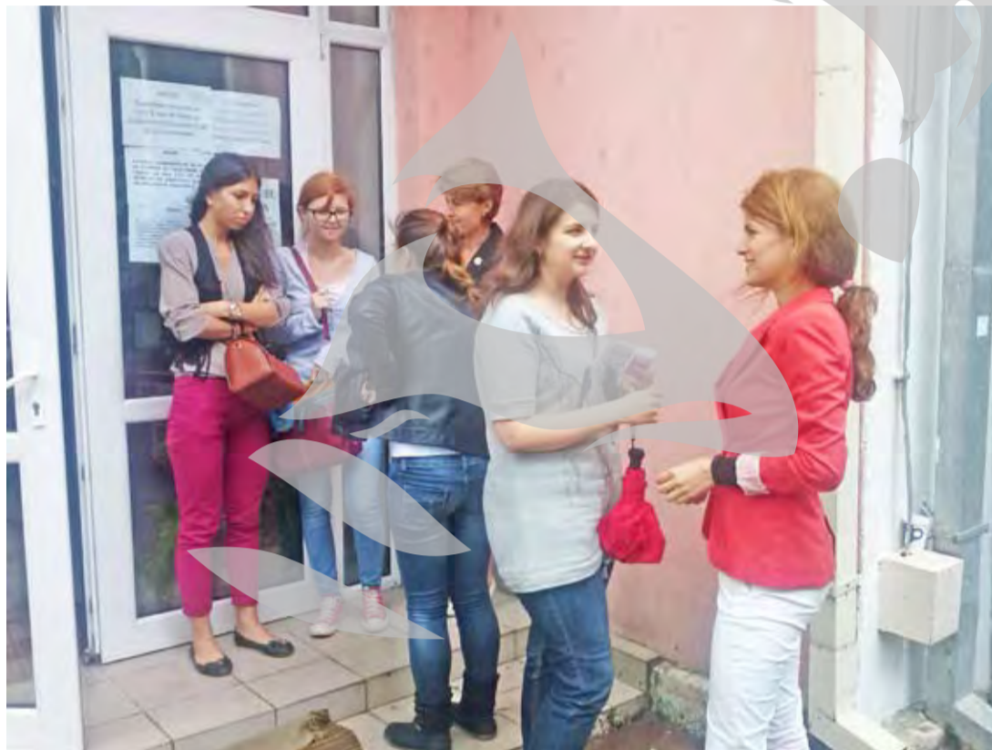
Miercuri, proba la matematică și istorie