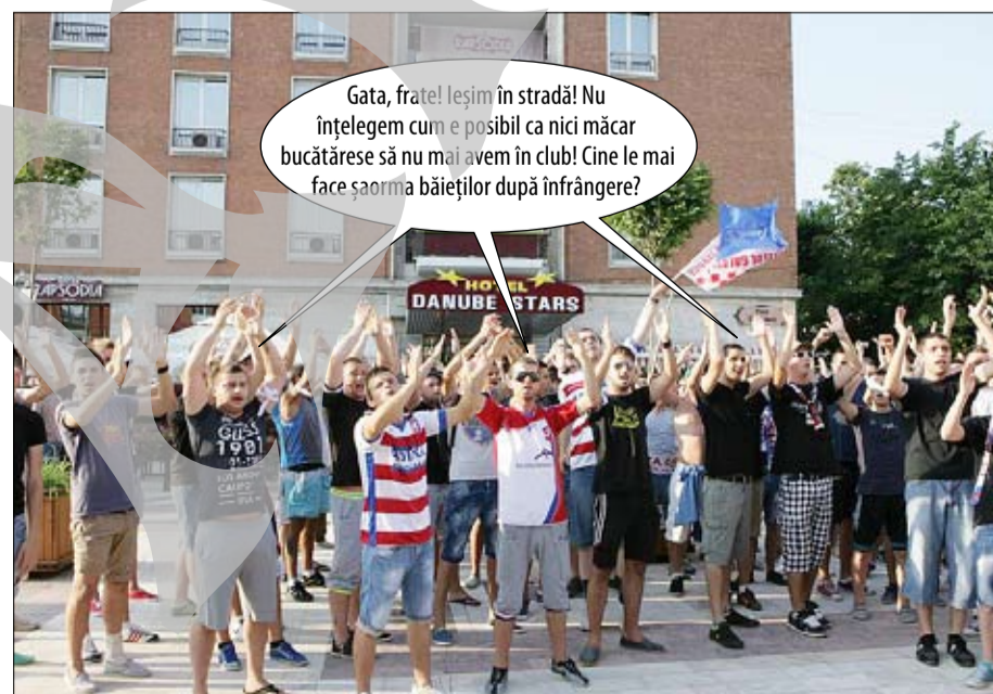
Galeria Oțelului iese în stradă pentru dreptul la șaorma