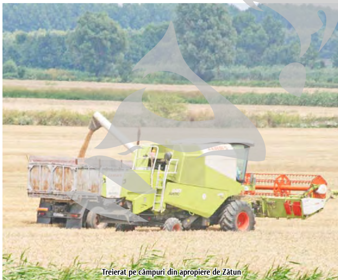
Treierat pe câmpuri din apropiere de Zătun