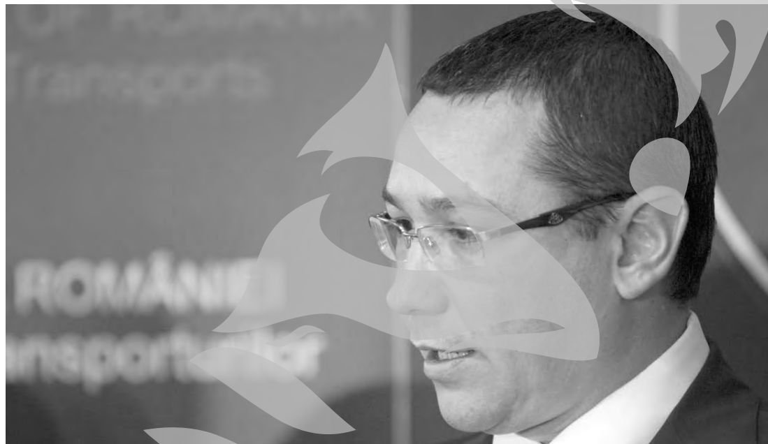
Ovidiu Silaghi nu poate justifica 45.000 de euro

Condamnarea la închisoare a ministrului Transporturilor reprezintă o premieră, fiind pentru prima dată când justiția din România condamnă la închisoare un ministru aflat în funcție.