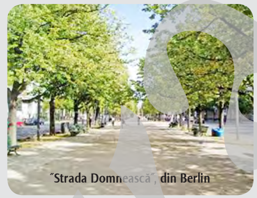
„Strada Domnească” din Berlin