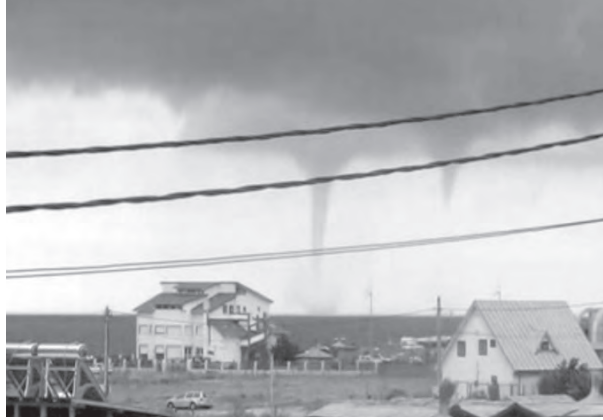
Tornadă la Vama Veche

De anul viitor Compensații pentru unii proprietari de păduri