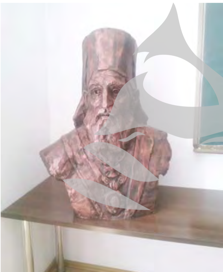
Un bust neinstalat (Melchisedec Ștefănescu)