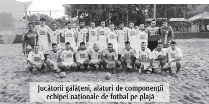
Jucătorii gălățeni, alături de componenții echipei naționale de fotbal pe plajă

Jucătorii evidențiați: Măciucă - 4 goluri și Florea - 3, respectiv, Mocanu - 3 și Răzvan Smadu - 2.