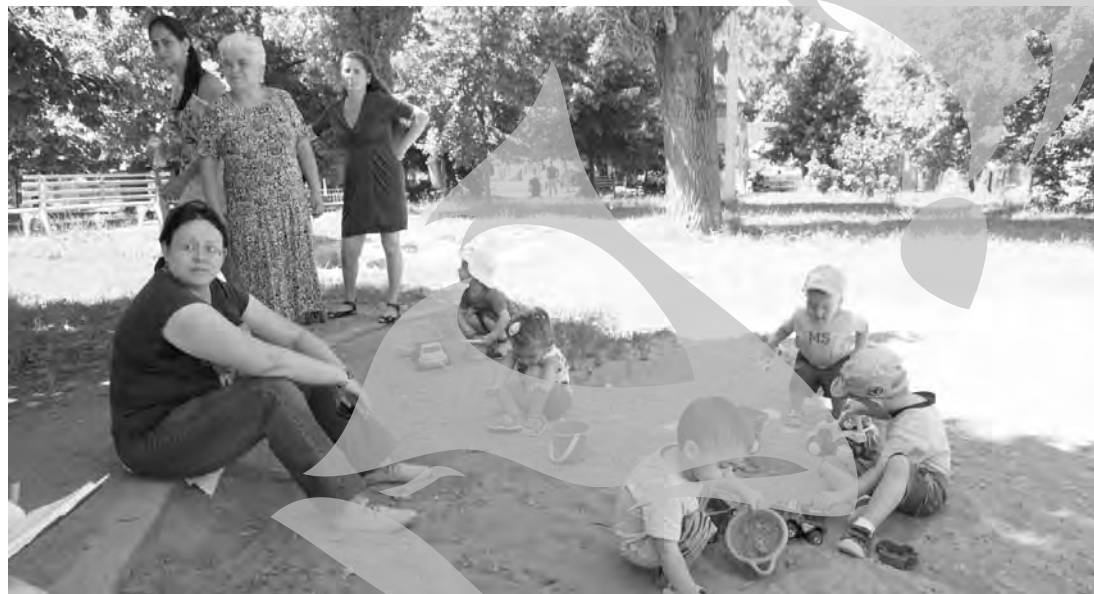
Groapa de nisip nu prea mai are materie primă