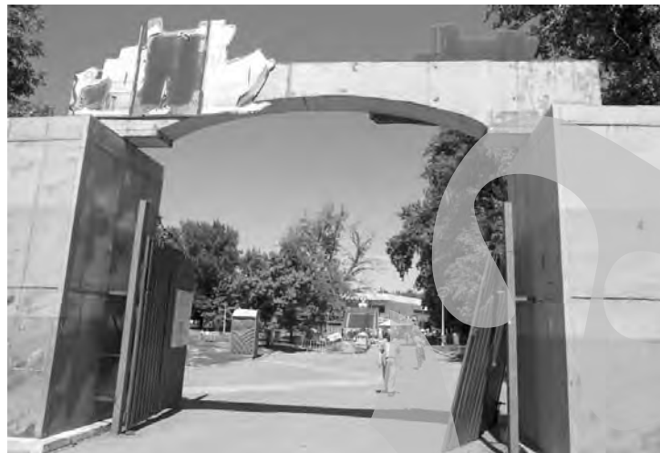
De la intrare, paragina e vizibilă cu ochiul liber

Pericolele mari sunt însă, de regulă, cel mai puțin vizibile. Lângă groapa cu nisip e o gură de canalizare pe jumătate surpată. Dosite după un copac, două panouri de electricitate, unul de dimensiuni mari, se deschid