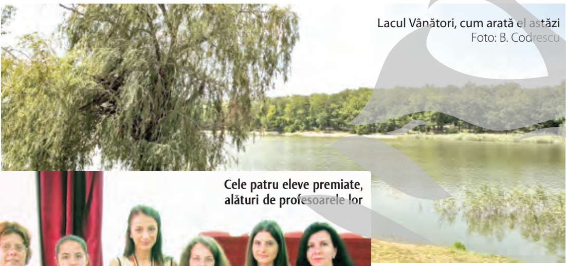
Lacul Vânători, cum arată el astăzi