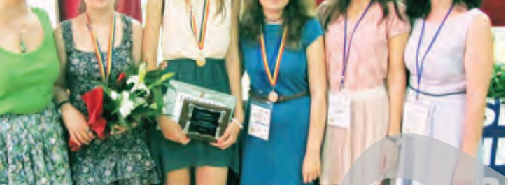
Cele patru eleve premiate, alături de profesoarele lor