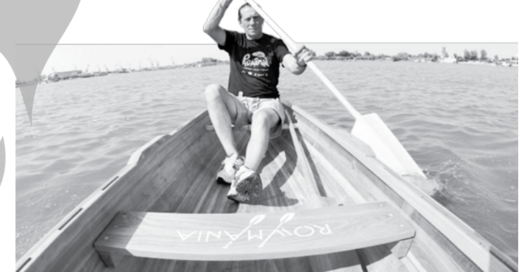
Celebrul Ivan Patzaichin își aduce canotcile la Galați

Gălățeni, vă simțiți suficient de puternici pentru a vă lua la întrecere cu Dunărea? Nu trebuie să fiți buni înotători - deși nu strică, ci buni vâsleși. Primăria Municipiului Galați și Asociația Ivan Patzaichin - Mila 23 organizează curse de sprint în canotci în cadrul unui Festival Nautic pe Dunăre, zona Elice. Conform purtătorului de cuvânt al Primăriei Galați, Mihai Costache, pot participa echipe de câte 11 persoane, indiferent de vârstă, constituție sportivă sau experiență, dar cu o stare de sănătate optimă. Inscriserile se vor putea face în zona Elice, pe Faleză Inferioară, la standul Asociației „Ivan Patzaichin Mila 23”, începând cu ora 11,30. Până la ora intrării în concurs, 13,00, membrii Asociației vor asigura instrucțiunile participanților. Premierea celor mai puternici vâsleși va avea loc după-amiază, la ora 16,45.