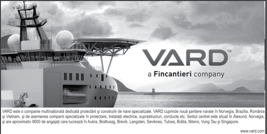
VARD este o companie multinațională dedicată proiectării și construirii de nave specializate. VARD cuprinde nouă șantiere navale în Norvegia, Brazilia, România și Vietnam, și de asemenea companii specializate în proiectare, instalații electrice, suprastructuri, conducte etc. Sediu central este situat în Ålesund, Norvegia, și are aproximativ 9000 de angajați care lucrează în Aukra, Brattvaag, Brevik, Langsten, Soviknes, Tulcea, Brăila, Niteroi, Vung Tau și Singapore.