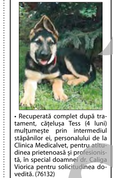
• Recuperată complet după tratament, cățelușă Tess (4 luni) mulțumeste prin intermediul stăpânilor ei, personalului de la Clinica Medicalvet, pentru atitudinea prietenoasă și profesională, în special doamnei dr. Caliga Viorica pentru sollicitudinea dovedită. (76132)

• SC ELISEEA oferim cazare- 15 lei persoană; 3 mese/ zi la 35 lei persoană. 0758628329. (76085)