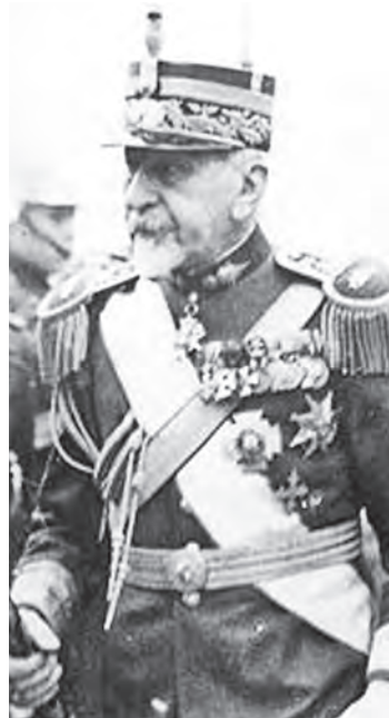
șef al Marelui Cartier General (1916-1918); șef al Marelui Stat Major (1918-1920).

Constantin Prezan (n. 27 ianuarie 1861) a optat pentru o carieră militară, urmând, mai întâi, cursurile Școlii de Ofițeri de Infanterie și Cavalerie, apoi pe cele ale Școlii Speciale de Artilerie și Geniu, după care a continuat să studieze la Școala de Aplicație de Artilerie și de Geniu de la Fotaiebleau, Franța. A urcat treptele ierarhiei militare până la gradul de mareșal, atribuit în anul 1930. A desfășurat activitate didactică, ca profesor pregător de Fortificații, la Școala de Aplicație de Artilerie și de Geniu, elaborând și un important „Curs de fortificații”. A ocupat, în timp, importante funcții militare: comandant al Diviziilor 3 (din 1910) și 7 Infanterie (din 1911); comandant al Corpurilor 3 (1914) și 4 (1915); comandant al Armatei de Nord (1916); comandant al Grupurilor de Armate „Prezan” (noiembrie-decembrie 1916);