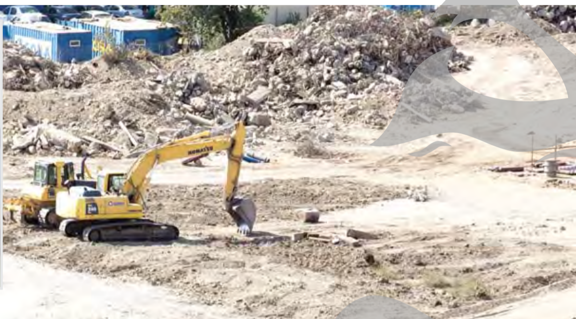
Locul unde a fost găsită bomba - din nefericire, oamenii au distrus complet, de bunăvoie, toate hangarele fostului Aeroport