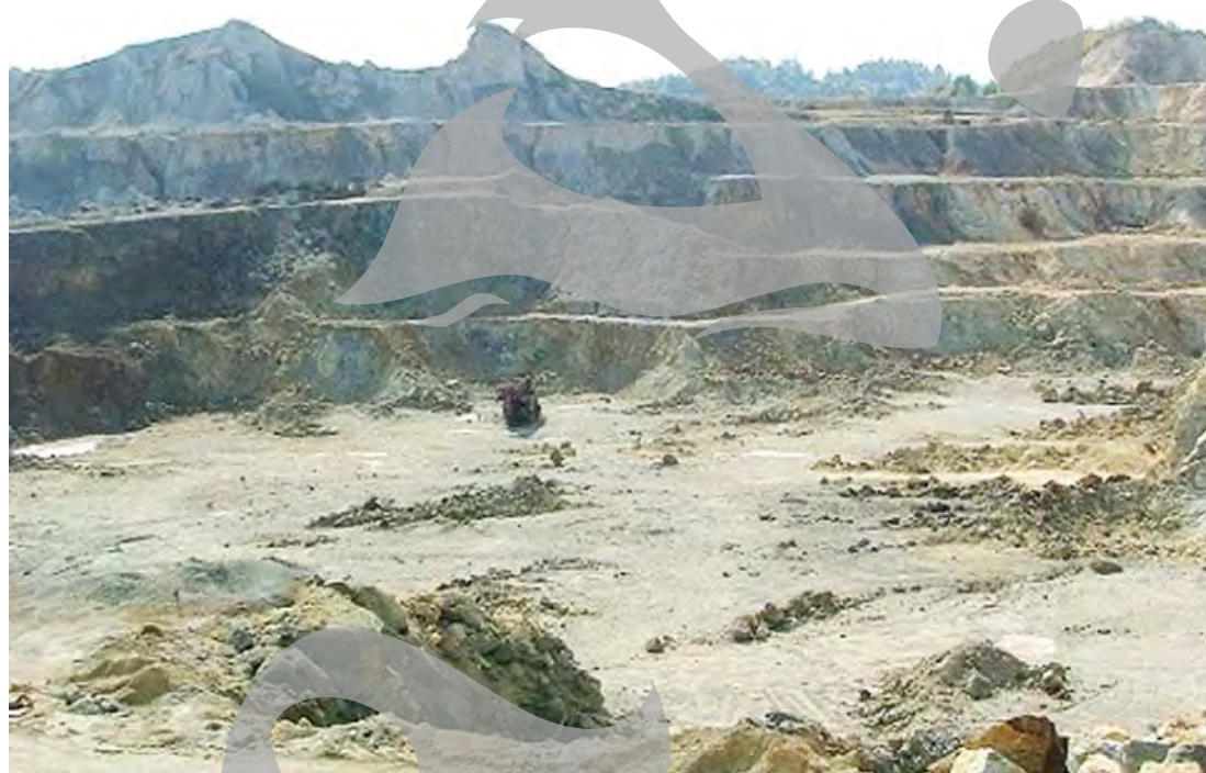
Pentru începerea activității în zona mineralieră se așteaptă avizul Parlamentului

Compania deține la Roșia Montană (Județul Alba), prin concesionarea în vederea exploatarei, cel mai important zăcămint de aur din România, evaluat la aproximativ 300 de tone de aur