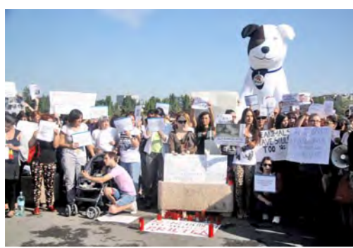
Aproximativ 250 de persoane au fost prezente ieri la un miting împotriva eutanasierii câinilor fără stăpân, desfășurat în Parcul Izvor

Comisia juridică din Senat a adoptat ieri, în unanimitate, un aviz negativ la proiectul de lege privind unele măsuri aferente exploatareii minereilor auro-argintifere din perimetrul Roșia Montană și stimularea și facilitarea dezvoltării activităților miniere în România. Senatul este prima cameră sesizată în cazul acestui proiect de lege.