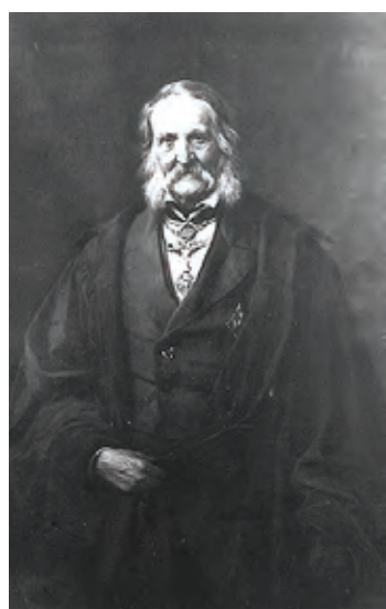
Fizicianul, matematicianul și mineralogul Franz Ernst Neumann

mann s-a născut în localitatea Mellin, (la nord-vest de Berlin), din Germania. A studiat la Jena și Berlin. În anul 1829, la recomandarea naturalistului german Alexander von Humboldt (1769-1859), a fost numit profesor la Catedra de Fizică și Mineralogie a Universității din Königsburg. În anul 1834, a fondat, împreună cu matematicianul german C. G. Jacobi (1804-1851), primul Seminar de Fizică Matematică. Ulterior, a inaugurat, la Königsburg, Școala de Științe Exacte ale Naturii, al cărei laborator experimental l-a condus personal. Franz Ernst Neumann este considerat fondatorul fizicii matematice. El a avut contribuții notabile și în fizica moleculară, termodinamică, electromagne-