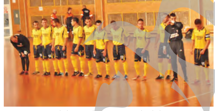
Jucătorii de la United, înainte partidei de luni seară