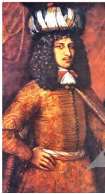
Cantemir, pe vremea când era zălog la turci

Folosirea armelor chimice în Siria, capul de afiș în ultima vreme,