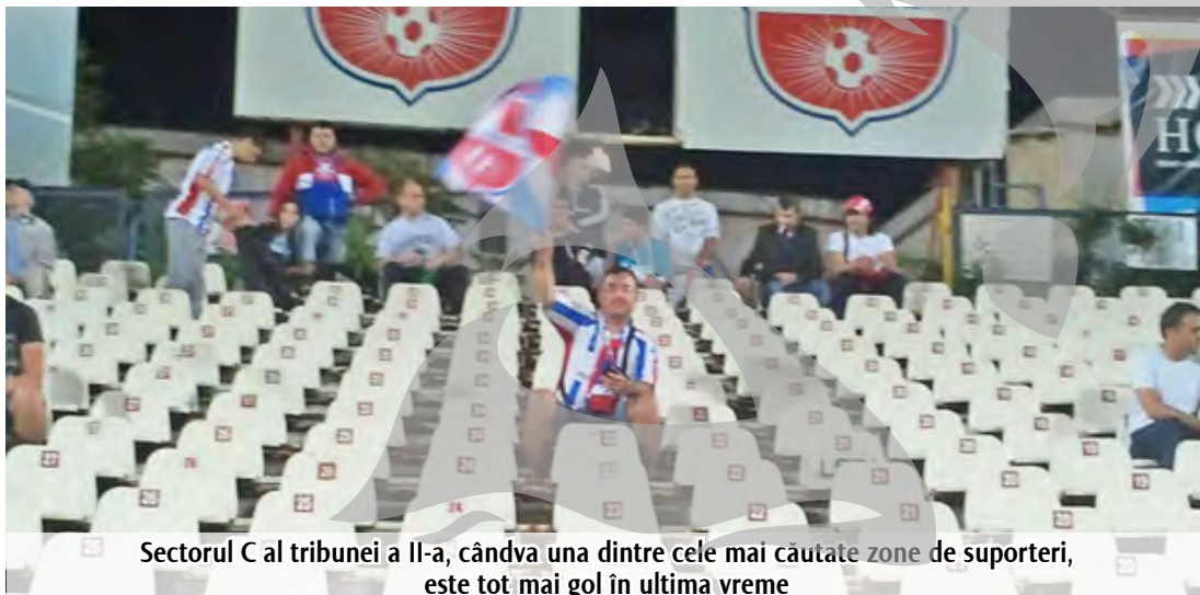
Sectorul C al tribunei a II-a, cândva una dintre cele mai cautate zone de suporter, este tot mai gol în ultima vreme

Numărul scăzut al suporterilor are mai multe cauze. Pe lângă intrarea clubului în insolvență, noua conducere a Oțelului a