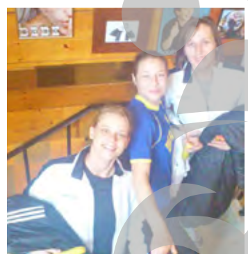
Cele trei ucrainence și-au luat zborul

Celelalte confruntări ale etapei întâi din Seria A sunt: Spartac București - Activ Plopeni, Sc. 181 București - Rapid București, Dunărea Giurgiu - HCF Piatra Neamț, Știința Bacău - CSU Târgoviște și Unirea Slobozia - HM Buzău.